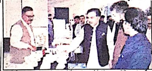
گورنر بلوچستان جعفر خان مندوخیل اسٹی ٹیوٹ آف آرکیٹیکچر پاکستان کے زیر اہتمام نمائش کا افتتاح کر رہے ہیں

انجینئرز اور آرکیٹیکٹس ہماری رہنمائی کر سکتے ہیں کہ ہم کس طرح ترقی کی پختگی کے توسط سے جدید عمارتیں بنا کر سکتے ہیں، ایڈوانسڈ اور جدید وغیرہ کے تیز رفتوری ہو جسے چمکانا پائیتے ہیں، آپ بتائیں کہ بلڈنگ کوڈ کے حوالے سے سائنس اینڈ انجینئرنگ کا کیا تصور کرنا ہے۔ انہوں نے کہا کہ وقت آچکا ہے کہ ہم جلد اپنے تمام اداروں اور محکموں کو کمپیوٹرائزڈ کریں، اس کیلئے سروسٹ تمام پیشہ ورانہ شعبوں میں ہمیں تعاون کی بجائے استعداد بڑھانے پر توجہ مرکوز کرنی ہوگی۔ جلی انہوں نے جعفر مندوخیل نے دیگر صوبوں سے آئے مہمانوں کا تحفہ مندوخیل کیا اور امید ظاہر کی کہ کوئٹہ میں ان کا قیام خوشگوار ہے، آخر میں گورنر بلوچستان نے مہمانان گرامی اور جعفر مندوخیل میں یادگاری شیلڈز تقسیم کیں اور نمائش میں لگے اسٹارٹ کا سائن کیا۔