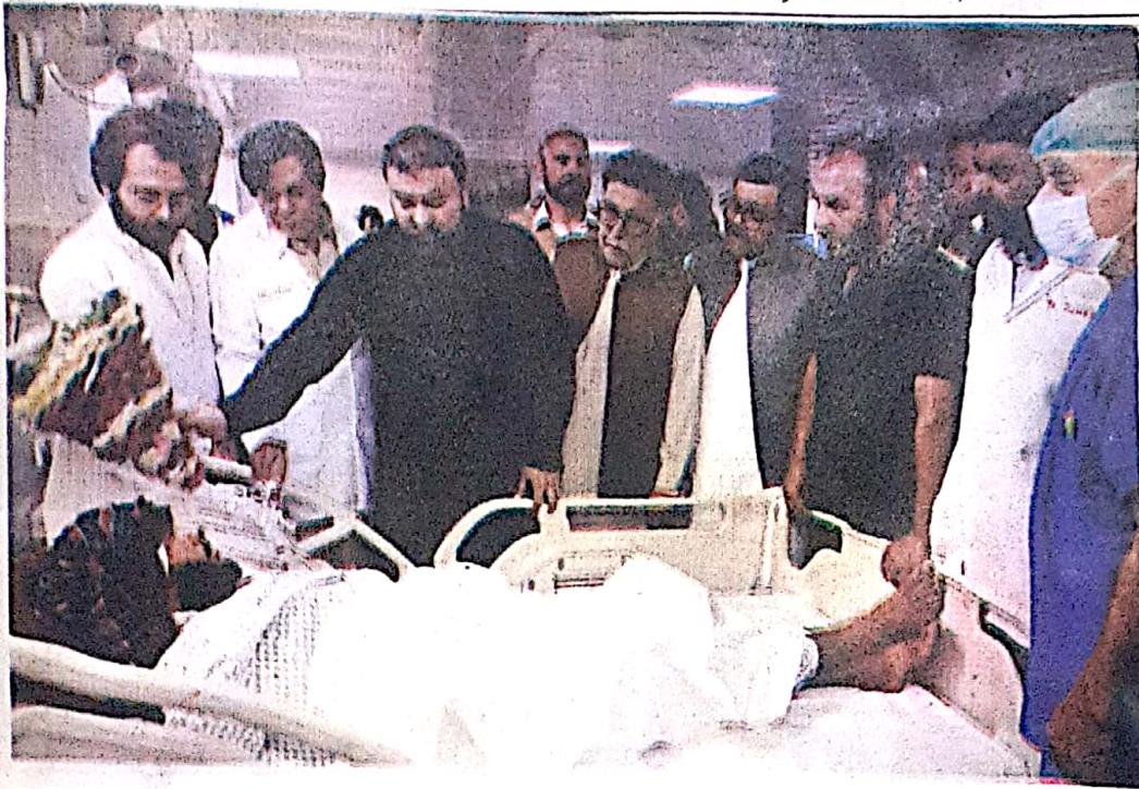
QUETTA: Chief Minister Mir Sarfraz Bugti visiting under treatment patients at Bugti Trauma Center on Sunday.