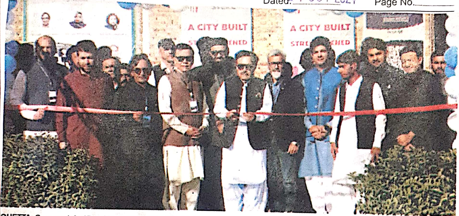
QUETTA: Governor Jafar Khan Mandukhel cutting ribbon to inaugurate an exhibition organized by Institute of Architects of Pakistan on Sunday.