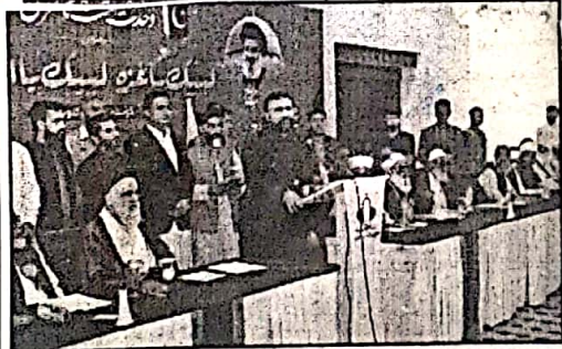
کوئٹہ، وزیر اعلیٰ بلوچستان سرسبز بلوچستان کی وحدت امت کانفرنس سے خطاب کر رہے ہیں

کے خلاف ہونے والے مظالم پر کچا آواز کھینچنا اعلیٰ جاہل واری ان خیالات کا اظہار انہیں نے اتوار کو یہاں وحدت امت کانفرنس سے خطاب کرتے ہوئے کیا وزیر اعلیٰ نے کہا کہ لسانی اور مذہبی بنیادوں پر تشدد بھی دہشت گردی ہے تقسیم اور مذہب کے نام پر تشدد پھیلانے والوں کو ناکام بنانا ہوگا سرسبز بلوچستان نے کہا کہ قوم پرستی اور مذہب کے نام پر ہونے والی دہشت گردی کو روکنا ہوگا ہمیں تشدد کے خلاف یکجا ہونا ہے اور اسے روکنا ہے، وزیر اعلیٰ بلوچستان نے کہا کہ سب سے بڑے خوف طاقتوں میں مسجد و دروں کو بے گناہ قتل کیا جاتا رہا اسلامی تعلیمات کے مطابق علم کے خلاف ہر کسی نے آواز بلند کرنی ہے ظلم کو ظلم کے جرات ہر کسی میں ہونی چاہئے سرسبز بلوچستان نے کہا کہ بلوچستان میں ہونے والی دہشت گردی کا ترقی کے غیر موازنہ سے تعلق نہیں۔