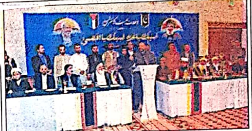
کوئٹہ، وزیر اعلیٰ بلوچستان میر فرخاندین صاحب کی تحریک بیداری امت مصطفیٰ کوئٹہ کے زیر اہتمام وحدت امت کانفرنس سے خطاب کر رہے ہیں مرکزی صدر سید جو اذتوی اور دیگر علماء و مشائخ پر موجود ہیں

ریاست کے سوا کسی کو یہ اجازت نہیں کہ وہ ہندو اٹھائے اور تشدد کا راستہ اختیار کرے اس کے خلاف ہمیں متحد ہونا ہوگا