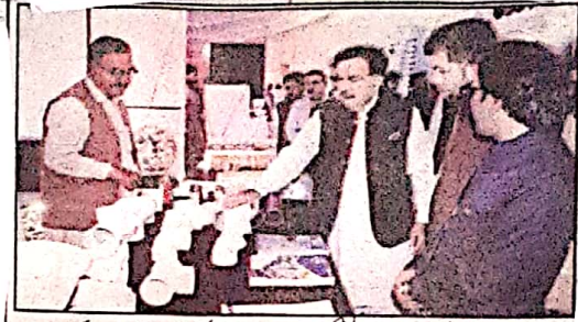
گورنر جعفر مندوخیل انٹرنیشنل آف آرکیٹیکچر کے زیر اہتمام نمائش کے افتتاح کا سائن کر رہے ہیں