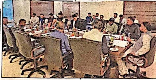
گوارڈ: وزیر اعلیٰ میر سرگودا بگٹی جی ڈی اے کی گورننگ باڈی کے اجلاس کی صدارت کر رہے ہیں