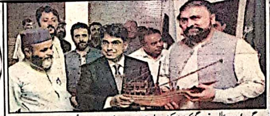
گوارڈی اور اعلیٰ سربراہی گوارڈی کے ذریعے شہادت شہوانی سوئٹرز دے رہے ہیں