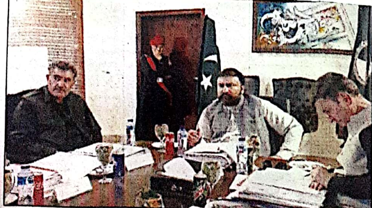
گوادرنہ میں اعلیٰ بلوچستان سربراہی گوادرنہ ڈویلپمنٹ اتھارٹی کی کونسل ہاؤس کا 29 واں اجلاس کی صدارت کر رہے ہیں

گوادرنہ میں منعقد ہوا اجلاس میں سہارٹ پورٹ ٹی، اور وسیع المدتی سکت مل پر بھی غور کیا گیا، وزیر اعلیٰ بلوچستان میر سرفراز بھٹی نے اجلاس سے خطاب کرتے ہوئے کہا کہ گوادرنہ عالمی معیار کا ترقی یافتہ شہر بنانے کے لئے تمام ٹیکسوں کو اخراج کی ضمانت اور جامع منصوبہ بندی کے تحت آگے بڑھنا ہوگا اور گوادرنہ میں منعقد ہوا اجلاس میں سہارٹ پورٹ ٹی، اور وسیع المدتی سکت مل پر بھی غور کیا گیا، وزیر اعلیٰ بلوچستان میر سرفراز بھٹی نے اجلاس سے خطاب کرتے ہوئے کہا کہ گوادرنہ عالمی معیار کا ترقی یافتہ شہر بنانے کے لئے تمام ٹیکسوں کو اخراج کی ضمانت اور جامع منصوبہ بندی کے تحت آگے بڑھنا ہوگا اور