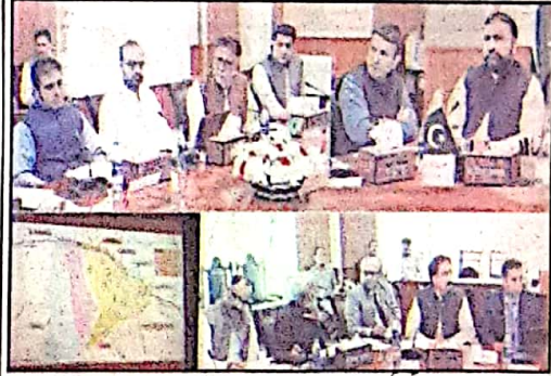
وزیر اعلیٰ بلوچستان سر فرراز بکٹی کی قیادت میں وفد سے متعلق جانورہ اجلاس کی صدارت کر رہے ہیں

بیٹنام میں وزیر اعلیٰ نے کہا کہ پاکستان اور چین کی دو قریبی علاقہ سے زیادہ اونچی اور سمندروں سے زیادہ گہری ہے انہوں نے کہا کہ پاکستان کے ساتھ اپنے تعلقات کو اپنی قدر کی نگاہ سے دیکھتا ہے انہوں نے کہا کہ پاکستان اقتصادی راہداری کی دو دنوں میں ملک کے بائیں اور یہ تعلقات میں مزید دھت کی ایک اہم کڑی ہے جس میں تجارت اور قریبی سمیت دیگر اہم منصوبوں پر کام کیا جا رہا ہے وزیر اعلیٰ نے کہا کہ کوئٹہ کی حکومت کی ایک جہاز تمام منصوبوں کی بروقت تکمیل کو یقینی بنانے کی جس سے صوبے میں ترقی و ترقی کے لیے مزید کام ہو سکتے ہیں۔