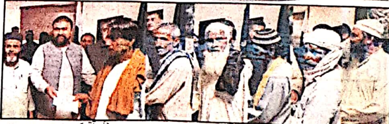
گوارا، وزیر اعلیٰ بلوچستان میر فرزانہ بیگم اور چیف سیکرٹری بلوچستان نے گوارا ڈیپنٹ اتھارٹی کی کارروائی کی غیر تسلی بخش قرار دی ہے۔

گوارا (سن) وزیر اعلیٰ بلوچستان میر فرزانہ بیگم اور چیف سیکرٹری بلوچستان نے گوارا ڈیپنٹ اتھارٹی کی کارروائی کی غیر تسلی بخش قرار دی ہے۔ جی ڈی اے انہیں بینک میں رکھ کر صرف ملازمین کی تنخواہیں اور گاڑیوں کے تیل کے لیے استعمال کرتا ہے۔ چیف سیکرٹری بلوچستان نے اسٹےجیوں سے گوارا کو خوبصورت بنایا جا سکتا تھا جی ڈی اے کو قواعد و ضوابط کے مطابق چلنا چاہئے گورننگ باڈی کے اجلاس سے وزیر اعلیٰ بلوچستان نے اظہار خیال کیا۔