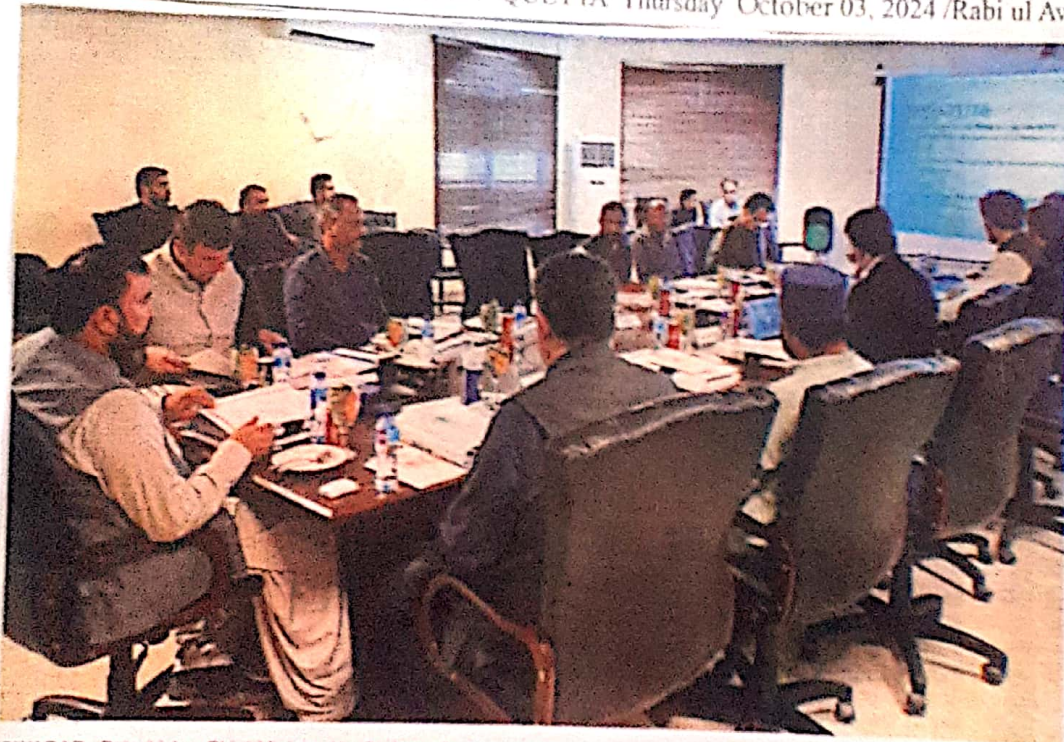
GWADAR: Balochistan Chief Minister Mir Sarfaraz Bugti presiding over meeting of the governing body of Gwadar Development Authority on Wednesday.