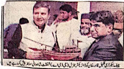
ایف ڈی سی کے سربراہ اور دیگر افسران نے، اس وقت کی ایف ڈی سی کے سربراہ اور دیگر افسران سے خطاب کر رہے ہیں۔