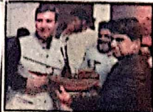
ایف ڈی سی کے سربراہ اور دیگر افسران نے، اس وقت کی ایف ڈی سی کے سربراہ اور دیگر افسران سے خطاب کر رہے ہیں۔