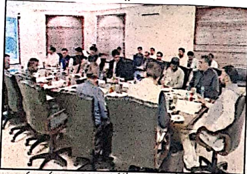
گوادر وزیر اعلیٰ بلوچستان سرفراز بھٹی گوادر ڈیپنٹ اتھارٹی کی گورننگ باڈی کے 29 واں اجلاس کی صدارت کر رہے ہیں

اجلاس میں اساتذہ پورٹ سی، گوادر ماسٹر پلان سمیت مختلف ایجنڈا ایٹمز پر غور و خوض کیا گیا گوادر (جیو رپورٹ) وزیر اعلیٰ بلوچستان میر سرفراز بھٹی کی زیر صدارت گوادر ڈیپنٹ اتھارٹی کی