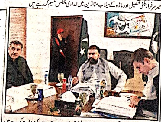
گوارا، وزیر اعلیٰ بلوچستان میر فرزانہ بیگم اور چیف سیکرٹری بلوچستان نے گوارا ڈیپنٹ اتھارٹی کی کارروائی کی غیر تسلی بخش قرار دی ہے۔

گوارا (سن) وزیر اعلیٰ بلوچستان میر فرزانہ بیگم اور چیف سیکرٹری بلوچستان نے گوارا ڈیپنٹ اتھارٹی کی کارروائی کی غیر تسلی بخش قرار دی ہے۔ جی ڈی اے انہیں بینک میں رکھ کر صرف ملازمین کی تنخواہیں اور گاڑیوں کے تیل کے لیے استعمال کرتا ہے۔ چیف سیکرٹری بلوچستان نے اسٹےجیوں سے گوارا کو خوبصورت بنایا جا سکتا تھا جی ڈی اے کو قواعد و ضوابط کے مطابق چلنا چاہئے گورننگ باڈی کے اجلاس سے وزیر اعلیٰ بلوچستان نے اظہار خیال کیا۔