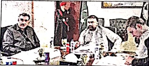
گوارڈ مابھی سر فراز بگٹی کی جی ڈی اے کی گورننگ باڈی کے 29 ویں اجلاس کی صدارت کر رہے ہیں

اجلاس گذشتہ روز گوارڈ میں منعقد ہوا اجلاس میں سارٹ پورٹ سٹی، گوارڈ ماسٹر پلان، گوارڈ سٹی، انڈر سٹریٹ، انڈر سٹریٹ سمیت مختلف ایجنڈہ پوائنٹس زیر غور آئے جبکہ جی ڈی اے کے مختصر المدتی منصوبے کا مابھیاں اور مدتی المدتی حکمت عملی پر بھی غور کیا گیا، وزیر اعلیٰ بلوچستان میر سر فراز بگٹی نے اجلاس سے خطاب کرتے ہوئے کہا کہ گوارڈ مابھی معیار کا ترقی یافتہ شہر بنانے کے لئے تمام کھسوں کو اشتراکی تعاون اور جامع منصوبہ بندی کے تحت آگے بڑھنا ہوگا اور ترقیاتی عمل میں مقامی آبادی کے مفادات کو مقدم رکھتے ہوئے ماسٹر پلان اور جیس بریکنگ یا رڈ کی تعمیر کے منصوبوں پر مابھی کیروں اور مقامی افراد کے تحفظات دور کرنا ہوں گے۔ وزیر اعلیٰ نے کہا کہ گوارڈ نہ صرف بلوچستان اور پاکستان بلکہ عالمی طور پر امرت کا مثال شہر ہے جہاں مستقبل کی ضروریات کو مد نظر رکھتے ہوئے ایسے منصوبوں کی تکمیل ناگزیر ہے جس سے مابھیاں عالمی سرایہ کاروں کے لئے سزاگاہ ماحول میر ہو 20 ہم ضروری ہے کہ ترقی کے اس عمل میں مقامی افراد کی مشاورت کو یقینی بنا جائے وزیر اعلیٰ میر سر فراز بگٹی نے کہا کہ گوارڈ میں شہریوں کو بیٹے کے صاف پانی کی فراہمی کے لئے پبلک ہیلتھ انجینئرنگ ڈیپارٹمنٹ اور جی ڈی اے کے مابھیاں ڈسٹریکشن کا واقعہ یقین ہونا چاہئے کیونکہ دونوں ادارے ایک