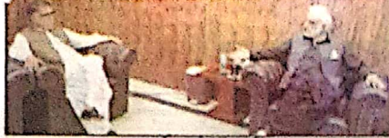
ایف ڈی سی کے سربراہ اور دیگر افسران نے، اس وقت کی ایف ڈی سی کے سربراہ اور دیگر افسران سے خطاب کر رہے ہیں۔