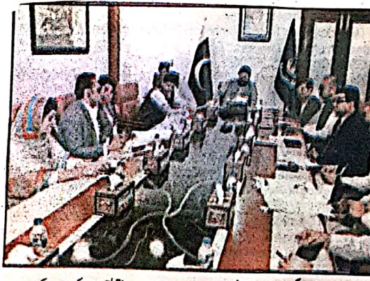
اکنامک زون (وزیر اعلیٰ بلوچستان میر سرفراز بگٹی کی زیر صدارت صوبے میں پراجیکٹ اینڈ اکنامک زون کی تشکیل سے متعلق جانورہ اجلاس بدھ کے روز