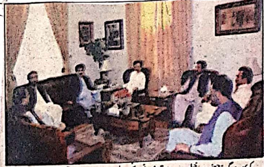
کوئٹہ: گورنر محترمہ مندوخل سے صادق بخاری، برکت علی، سینیٹر میراقتاد اور دیگر ملاقات کر رہے ہیں