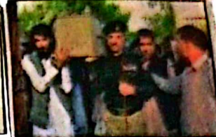
آئی جی پولیس معظم جاہ انصاری کچلاک دھماکے میں شہید ہلاکار کے جنازے کو کندھا دے رہے ہیں