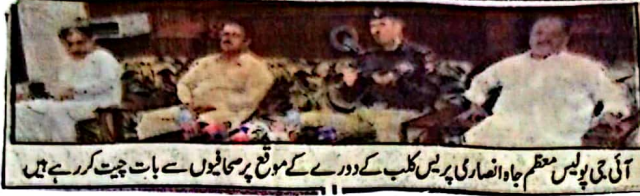
آئی جی پولیس معظم جاہ انصاری پریس کلب کے دورے کے موقع پر صحافیوں سے بات چیت کر رہے ہیں