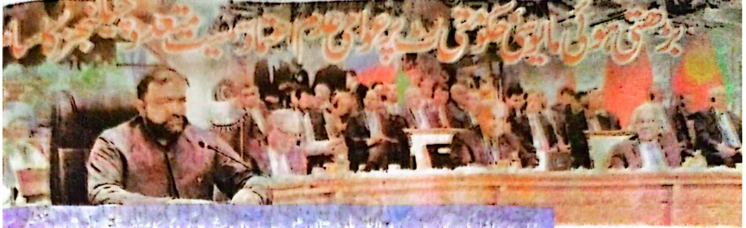
وزارت اطلاعاتی رپورٹ کے مطابق بلوچستان میں سلسلہ وار دہشت گردی کا مقصد انتہائی مذہبی تنظیم