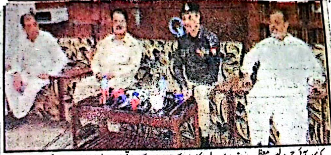
کوئٹہ، آئی جی پولیس معظم جاہ انصاری پریس کلب کے دورے کے موقع پر میڈیا سے بات چیت کر رہے ہیں