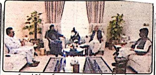
وزیر اعلیٰ میر مرتضیٰ سید شاہد نے سیکرٹری ہاؤس کے سربراہ ڈاکٹر مالک بلوچ اور اراکین صوبائی اسمبلی ملاقات کر رہے ہیں۔