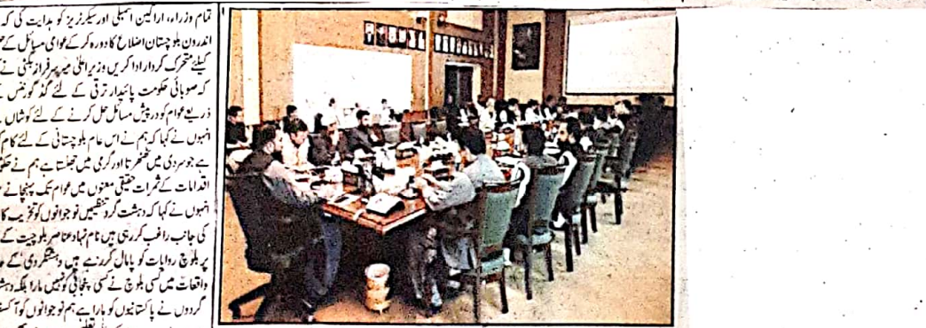
وزیر اعلیٰ بلوچستان میر فرخ اندیش صوبائی گورنمنٹ آف بلوچستان سے خطاب کر رہے ہیں

گورنمنٹ آف بلوچستان میں اضافہ کیلئے اصلاحات کا سلسلہ برقرار رکھے گا اور اس میں پبلک ریلیشنز کے امور میں اضافہ کی منظوری دی جائے گی اور اس کے تحت 2023 کی پالیسی کی منظوری دی اور اس کے تحت پبلک ریلیشنز کے لئے 100 بلوچ اہلکاروں کی خدمات مقرر کی گئی ہیں، گورنمنٹ آف بلوچستان سے خطاب