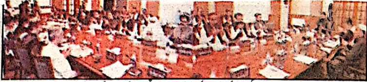
وزیر اعلیٰ بلوچستان میر مرتضیٰ سید شاہد نے صوبائی وزراء صوبائی کابینہ کے اجلاس سے قبل شہداء کی معفرت کیلئے دعا کر رہے ہیں۔