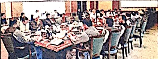
وزیر اعلیٰ بلوچستان میر سرفراز میٹھی صوبائی کابینہ کے اجلاس کی صدارت کر رہے ہیں

جاہت کی کہ وہ عدنان بلوچستان اصلاح کا دورہ کر کے عوامی مسائل کے حل کیلئے تحریک گمراہ کر رہی ہیں وزیر اعلیٰ میر سرفراز نے کہا کہ صوبائی حکومت پاسیڈرٹی کے لئے گورنرس کے ذریعے تمام گورنرس مسائل حل کرنے کے لئے کوشاں ہے انہوں نے کہا کہ ہم نے اس عام بلوچستانی کے لئے کام کرنا ہے جو سردی میں ظلمت اور گرمی میں جھاتا ہے ہم نے مختصری اقدامات کے شرک حقیقی معنوں میں عوام تک پہنچانے ہیں انہوں نے کہا کہ بدت گورنرس لوجزوں کو تخریب کاری کی جانب راغب کر رہی ہیں نام نہاد حاضر بلوچیت کے نام پر بلوچ رعایات کو پائل کر رہے ہیں دیکھو وی کے حالیہ واقعات میں کسی بلوچ نے کسی ہتھیالی کو ٹکس مانا بلکہ بدت کردوں نے پاکستانوں کو مانا ہے ہم لوجزوں کو آسٹریٹ اور ہارڈ سمیت دنیا کے ہائی ٹیک ای اداروں میں سمجھ رہے ہیں جبکہ مختصر تھیں اور ان کے سرفز لوجزوں کو ہٹا کر تخریبی کارستانیوں کی جانب راغب کر رہے ہیں بلوچستان کے عوام کو ٹھیک کر رہے کہ ان کے بچوں کو تھیم دیا رہا ہے اور انہیں تخریب کاری کی جانب راغب رہا ہے حکومت نیچے عوام کو سٹل جھٹوں کے حوالے نہیں کرے گی اور ریاست کی عملداری مکمل طور پر قائم رکھی