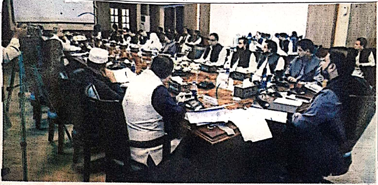
QUETTA: Chief Minister Balochistan Mir Sarfraz Bugti presiding over a provincial cabinet meeting on Wednesday.