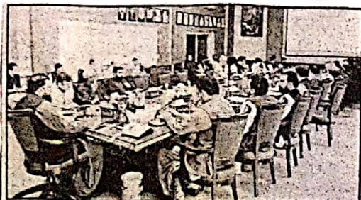
کوئٹہ، وزیر اعلیٰ بلوچستان میر فرزانہ کھٹی کی صدارت میں اجلاس کی صدارت کر رہے ہیں

نہیں تھے مختلف تنظیموں نے جو ان کی غلام خیزی کا واسیون راغب کرتے ہیں میر فرزانہ نے کہا کہ صوبائی حکومت پر وزارتی کے لئے کوئٹہ کے وزیر اعلیٰ بلوچستان میر فرزانہ کھٹی کی زیر صدارت صوبائی کانینے کا اجلاس بدھ کے روز پھان وزیر اعلیٰ سکرٹریٹ میں منعقد ہوا کانینے کے مرتبہ ماہ چیل آنے والے دشت گردی کے واقعات کی پر زور مذمت کی اور ان واقعات میں شہید ہونے والے افراد کے لئے فخر خانی کی کئی اصلاحات کا تسلسل برقرار رکھنے کا مزم کرتے