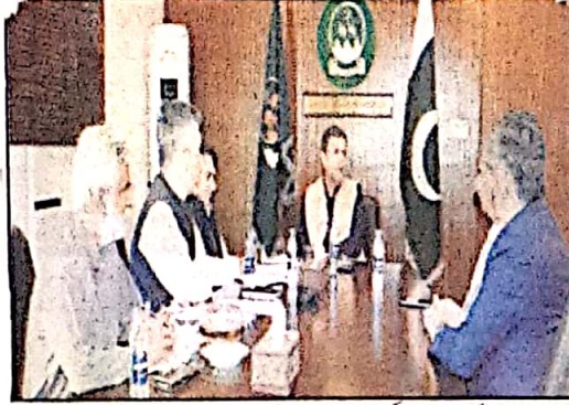
چیف سیکرٹری بلوچستان قلیل کارروائیوں سے کے ایگزیکٹو کے آفیسران ملاقات کر رہے ہیں