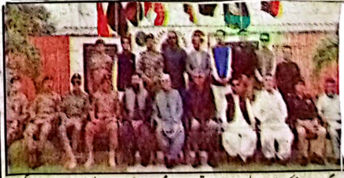
گوادر صدر مملکت آصف علی زرداری وفاقی وزیر داخلہ محسن نقوی وزیراعلیٰ بلوچستان میر سرفراز بھٹی صوبائی وزیر داخلہ میر ضیاء اللہ گکو رکن صوبائی اسمبلی مولانا ہاربت الرحمان اور دیگر کارپورٹونو

کی پیشہ وارانہ استعداد کار میں اضافہ کیا جا رہا ہے ان خیالات کا اظہار انہوں نے جمعرات کو یہاں صدر مملکت آصف علی زرداری کی زیر صدارت امن وامان اور بلوچستان میں جاری ترقیاتی منصوبوں سے متعلق اجلاس میں اظہار خیال کرتے ہوئے کیا۔ وزیراعلیٰ میر سرفراز بھٹی نے کہا کہ تمام اسٹیک ہولڈرز کو بلوچستان کی ترقی کے لئے قومی اتفاق رائے پیدا کرنا ہوگا، دہشت گردی کی مغفرت سے منہ پھرنے کیلئے اجتماعی کوششیں تیز کرنے کی ضرورت ہے، وزیراعلیٰ نے صدر مملکت کی بلوچستان پر خصوصی توجہ اور دوروں کو خوش آئند قرار دیا ہے ہونے کہا کہ صدر آصف علی زرداری کے بارہا دوروں سے بلوچستان کے عوام کو اپنائیت کا احساس بھر رہا ہے ان کی بلوچستان اور یہاں کے عوام سے محبت کو ایمان بلوچستان قدر کی نگاہ سے دیکھتے ہیں، وزیراعلیٰ بلوچستان نے صوبے کی ترقی کے لئے مرتب کردہ حکمت عملی پر روشنی ڈالنے ہوئے کہا کہ بلوچستان میں فروغ تعلیم کیلئے بینظیر سٹوڈنٹس کالرشپ کا تازہ ترین پروگرام شروع کیا گیا ہے جس میں اعلیٰ ترین سمیت تمام طبقات کیلئے کوٹھنیشن کیا گیا ہے تاکہ پسماندہ طبقات کو تعلیمی ترقی کے ذریعے آگے بڑھنے کے مواقع میسر آسکیں، میر سرفراز بھٹی نے آگاہ کیا کہ چیمبرین پاکستان پیپلز پارٹی بلاول بھٹی کی ہدایت کی روئی میں بلوچستان کے طبی شعبے کو پبلک پرائیویٹ پارٹنرشپ کے تحت جدید خطوط پر استوار کرنے کے لئے قابل عمل پالیسیاں مرتب کی جا رہی ہیں، صوبائی بجٹ میں طبی تعلیم و صحت کے لئے غیر معمولی وسائل مختص کیے جا رہے ہیں، صوبائی حکومت نے آئندہ دو سالوں کے دوران تیس ہزار جوانوں کو بہتر مندر بنا کر بیرون ملک روزگار کے مواقع فراہم کرنے کا منصوبہ بنایا ہے اس کے علاوہ ہر روزگار کو بھجوش کو بلا سود قرضے