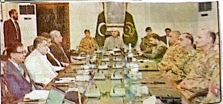
گوادر صدر مملکت آصف علی زرداری بلوچستان میں امن وامان کی صورتحال سے متعلق اجلاس کی صدارت کر رہے ہیں جبکہ وزیر داخلہ محسن نقوی، وزیراعلیٰ میر سرفراز بھٹی، ملک شاہ گورگچ، وزیر داخلہ میر ضیاء اللہ گکو، مولانا ہاربت الرحمان اور دیگر اعلیٰ سول ڈوٹی حکام موجود ہے

فرہم کر کے کاروبار کے لئے موزوں معاہدات فراہم کریں گے میر سرفراز بھٹی نے اجلاس کو بتایا کہ گوادر کے ماسی گیریوں کی بہبود کیلئے بھی غیر معمولی اقدامات اٹھائے جارہے ہیں پاک ایران بارڈر پر ایرانی زائرین کی سیکورٹی اور انہیں سہولیات کی فراہمی کیلئے صوبائی حکومت نے مختلف حکموں اور انتظامی احکامات کو جاری کر دی ہے وزیراعلیٰ نے کہا کہ عوام نے منتخب صوبائی حکومت سے جو توقعات وابستہ کر رکھی ہیں اس پر پورا اترنے کیلئے تمام دستیاب وسائل بروئے کار لائے جائیں گے وزیراعلیٰ میر سرفراز بھٹی نے کہا کہ صدر مملکت آصف علی زرداری کی رہنمائی میں صوبائی حکومت صوبے سے پسماندگی کے خاتمے اور عوام کا معیار زندگی بلند کرنے کیلئے بھرپور اقدامات اٹھائے گی، صدر مملکت کی زیر صدارت منعقد ہونے والے اجلاس میں وفاقی وزیر داخلہ محسن نقوی، وزیر داخلہ بلوچستان میر ضیاء اللہ گکو، گوادر سے منتخب رکن قومی اسمبلی ملک شاہ گورگچ، رکن صوبائی اسمبلی مولانا ہاربت الرحمان، ایف ایس ایچ چیف سیکرٹری داخلہ زائد سلیب، انسپکٹر جنرل پولیس بلوچستان عبدالقادر خان سمیت اعلیٰ حکام نے شرکت کی۔