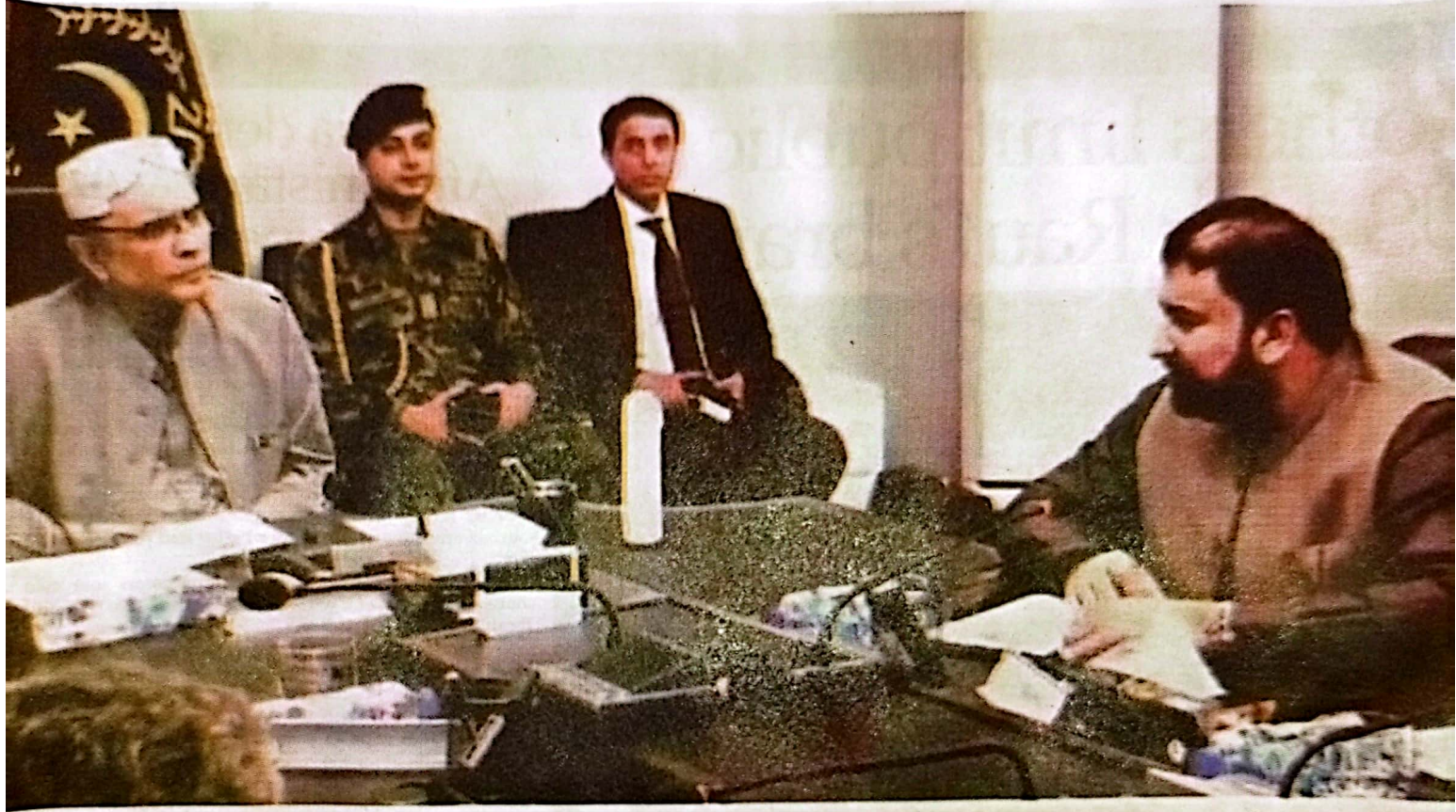
WADAR: President Asif Ali Zardari exchanging views with Chief Minister Balochistan Sarfraz Bugti on Thursday.