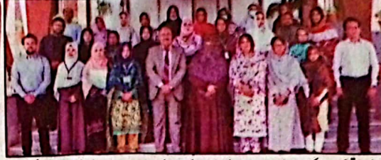
مشیر ترقی نسواں ڈاکٹر ربابہ بلیدی کا اسٹیٹ بینک آف پاکستان کے زیر اہتمام سیمینار کے شرکاء کے ہمراہ گروپ