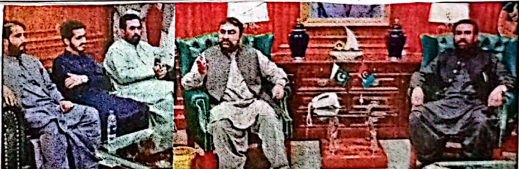
کوئٹہ، وزیر اعلیٰ بلوچستان میر سر فراز بگٹی سے صوبائی وزیر زراعت میر علی مدد جنگ ملاقات کر رہے ہیں

اور بلوچستان میں جاری ترقیاتی منصوبوں سے متعلق اجلاس میں اظہار خیال کرتے ہوئے، وزیر اعلیٰ میر سر فراز بگٹی نے کہا کہ تمام اسٹیک ہولڈرز کو بلوچستان کی ترقی کے لئے قومی اقدار رامنے پیدا کرنا ہوگا، وراثت گروہ کی معرفت سے منظم کیلئے اجتماعی کوششیں کرنا کی ضرورت ہے، وزیر اعلیٰ نے صدر ملک کی بلوچستان پر خصوصی توجہ اور دوروں کو خوش آمد قرار دیتے ہوئے کہا کہ صدر آصف علی زرداری کے بارہا دوروں سے بلوچستان کے عوام کو اپنائیت کا احساس دہا رہا ہے ان کی بلوچستان اور یہاں کے عوام سے محبت و دلچسپی کو اہلیان بلوچستان قدر کی نگاہ سے دیکھتے ہیں، وزیر اعلیٰ بلوچستان نے صوبے کی ترقی کے لئے سرب کورہ حکمت عملی پر روشنی ڈالتے ہوئے کہا کہ بلوچستان میں فروغ تعلیم کے لئے بینظیر ہونو اسکالرشپ کا تاریخی پروگرام شروع کیا گیا ہے جس میں لاکھوں سمیت تمام طبقات کے لئے کوٹیشن کیا گیا ہے تاکہ پسماندہ طبقات کو تعلیمی ترقی کے ذریعے آگے بڑھنے کے مواقع میرا سکیں، میر فراز بگٹی نے آگاہ کیا کہ چتر میں پاکستان پیپلز پارٹی پارلیمینٹ کی ہدایت کی راہ میں بلوچستان کے کئی شعبے کو پبلک پرائیویٹ پارٹنرشپ کے تحت جدید خطوط پر استوار کرنے کے لئے قابل عمل پالیسیاں مرتب کی جا رہی ہیں، صوبائی بجٹ میں کئی تعلیم و صحت کے لیے غیر معمولی وسائل مختص کئے جا رہے ہیں، صوبائی حکومت نے آئندہ دوروں کے دوران کئی نئے پروگراموں کو بہتر بنا کر جوں جوں ملک