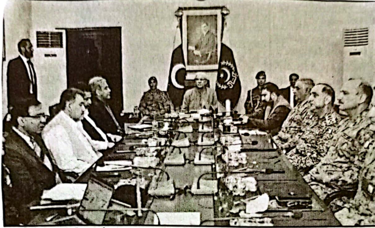
گوارہمد رگت آصف علی زرداری بلوچستان میں امن وامان کی صورتحال کے حوالے سے اجلاس کی صدارت کر رہے ہیں