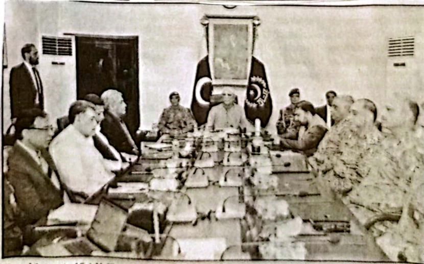
President Asif Ali Zardari chairing a meeting on the security and law and order situation of Balochistan in Gwadar.