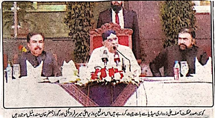
کوئٹہ، صدر ملک آصف علی زرداری میڈیا سے بات چیت کر رہے ہیں اس موقع پر وزیر اعلیٰ بلوچستان میرزا زین العابدین اور گورنر جنرل خان مسعود شمل موجود ہیں

عبداللہ گورج پراسیکیوٹن، سہم گورج قانون و پارلیمانی امور، مجید باوینی فرسٹ سٹریٹ، میرا سٹریٹ انرجی اور حامی محمد خان ایف ڈی اے ڈی، ایف ڈی اے ڈی، ایف ڈی اے ڈی پارلیمانی سیکرٹری مقرر کیا گیا، پارلیمانی سیکرٹری مقرر کیا گیا، پارلیمانی سیکرٹری مقرر کیا گیا پاکستان سٹیٹ پاور کمپنی (پبلک) کے 7 جبکہ جماعت اسلامی کے 11 ایف ڈی اے ڈی، پارلیمانی سیکرٹری مقرر کیا گیا۔