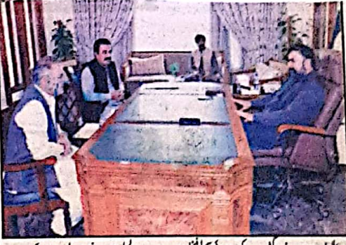
وزیر اعلیٰ بلوچستان سر مرزا یحییٰ گندم خری ازبک سے مشتق گل خرواراک کے اعلان کی صدارت کرتے ہیں

ہمارے معاشرے کا پڑھا لکھا طبقہ ہے جو کمزور ہیں اور کوتاہیوں کی نشاندہی کرتے ہیں اور معاشرے میں فتنہ پھیلانے والے عناصر اور منافقوں کے پھیلنے سے احتیاطی اقدام کرنا چاہئے۔ انہیں جیت حاصل ہے جو عوام کو مل جل جانے کے باوجود انہیں شعور اور آگہی فراہم کرنے میں اہم کردار ادا کر رہا ہے۔ وزیر اعلیٰ نے کہا کہ صحافی بقیہ نمبر 57 صفحہ 7