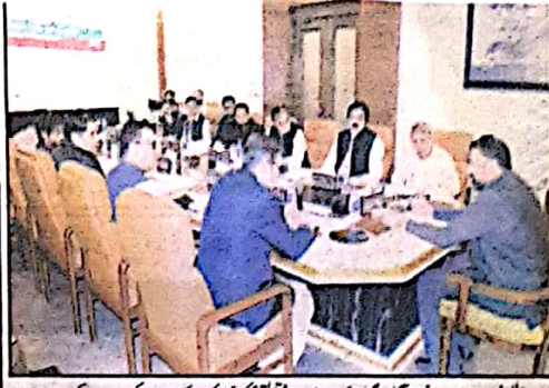
وزیر اعلیٰ بلوچستان سر مرزا یحییٰ گندم خری ازبک سے مشتق گل خرواراک کے اعلان کی صدارت کرتے ہیں

صوبائی حکومت صحافی برادری کے مسائل کا ادراک رکھتی ہے، وزیر اعلیٰ صحافی ہمارے معاشرے کا پڑھا لکھا طبقہ ہے جو کمزور ہیں اور کوتاہیوں کی نشاندہی کرتا ہے۔ انہیں جیت حاصل ہے جو عوام کو مل جل جانے کے باوجود انہیں شعور اور آگہی فراہم کرنے میں اہم کردار ادا کر رہا ہے۔ وزیر اعلیٰ نے کہا کہ صحافی بقیہ نمبر 57 صفحہ 7