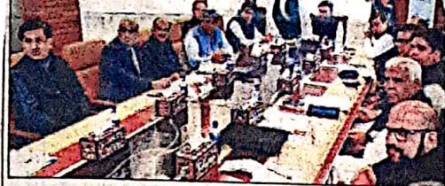
وزیر اعلیٰ بلوچستان میر سرفراز بگٹی کو نگر مواصلات سے متعلق بریفنگ دی جا رہی ہے