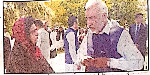
صوبائی وزیر سردار عبدالرحمن کھٹیران سے وزیر تعلیم راجہ سعید درانی بات چیت کر رہے ہیں