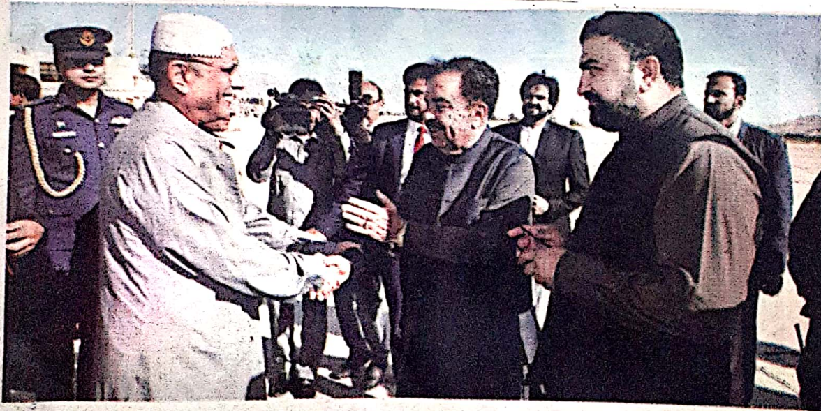
QUETTA: Newly appointed Governor Balochistan Sheikh Jafar Mandokhail receives President Zardari upon arrival in Quetta on Monday. CM Balochistan Sarfraz Bugti also present on the occasion.