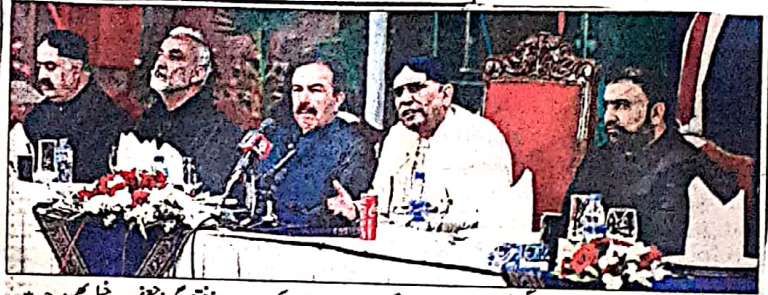
کوئٹہ: صدر آصف زرداری وزیر اعلیٰ سرفراز بگٹی کی جانب سے دیئے گئے عشائیے سے خطاب کر رہے ہیں بلوچستان گورنر محترمہ ذیل بھی موجود ہیں

صدر مملکت کے اعزاز میں دیئے گئے عشائیے سے خطاب کرتے ہوئے کیا انہوں نے صدر مملکت کو خوش آمدیہ کرتے ہوئے کہا کہ کافی عرصہ بعد ایک صدر مملکت دورہ کے لئے بلوچستان آئے ہیں بحیثیت صدر پہلے دور مصداقت میں بھی بلوچستان کے مسائل حل اور بلوچستان سمیت چاروں صوبوں کو اٹھانے کی تہم میں صوبائی خود مختاری آگین کے ذریعے دی گئی انہوں نے کہا کہ بلوچستان کے مسائل سیاسی بات چیت سے حل ہوں گے اور پورے پاکستان میں سیاسی مفادات کے خاطر خواہ تاج تاج ہوں گے، انہوں نے کہا کہ بلوچستان میں موسمیاتی تبدیلی، امن وامان، گورننس کے چیلنجز اور پیش ہیں سر سرفراز بگٹی نے ڈون آگے بڑھایا جائے گا۔