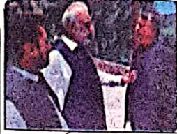
صوبائی وزیر سردار عبدالرحمان کھٹیران سابق گورنر ملک عبدالولی کا کڑے گفتگو کر رہے ہیں