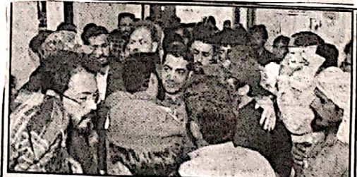
وزیر داخلہ بلوچستان میر شیاہد اللہ لاٹو گجراتی مسکن رہے ہیں