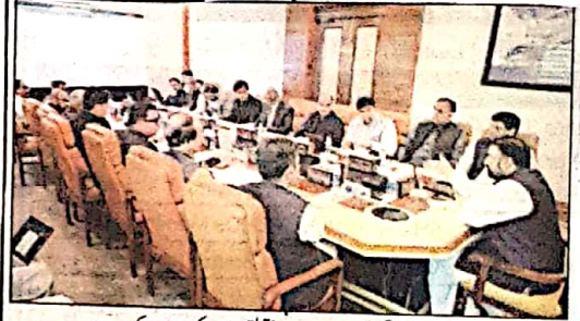
کوئٹہ صدر آصف زرداری وزیر اعلیٰ سرفراز بھٹی کی جانب سے دیے گئے مشاہیے کے موقع پر خطاب کر رہے ہیں