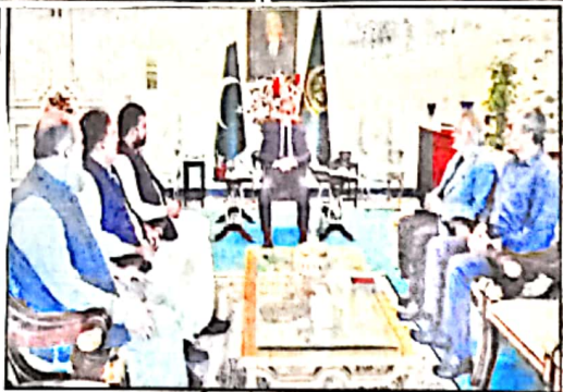
اسلام آباد، وزیراعظم شہباز شریف سے وزیر اعلیٰ بلوچستان میاں یاقتی ملاقات کر رہے ہیں

ہمارے پاس ماڈرن ہیں ای ریاست نے تو بخر نہیں مرنی کیا تھا مذاکرات کے باوجود وہ دن 30 میں ان کو واپس لایا گیا تھا ساتھ ہی انہوں نے پاکستان کا جیٹا اٹھایا اور سینئر لیڈر سمیت انڈین کیسٹ ان کا انٹرویو کیا اور ان کا حصر ہے انہوں نے کیا کہا تھا ان کے نقطہ سب کے سامنے ہیں جس طرح ہم نے ہالچ مری کو اٹھینڈ سے واپس پاکستان لایا اور ہم نے ان کو آئین جوائن کیا انہیں جوائن کے بعد انہوں نے جو (دار) کی فوج کھلی دہہ پاکستان میں کئی یہ بھی سارا پکارا حصر سے مری ڈالی رائے یہ ہے کہ میں گھوڑ حکمت کا وزیر اعلیٰ ہوں اس رائے کو سامنے رکھتے ہوئے کہتا ہوں کہ میں مذاکرات ضرور کرنا چاہئے کیا باہمی گفتگو سے مذاکرات کے بعد بلوچستان میں بغاوت ختم ہو جائیگی؟ اور ٹی ٹی وی بلوچستان کا ایک قومی حصر نہیں ہے