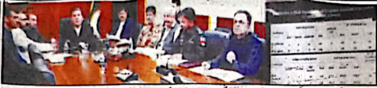
چیف سیکرٹری بلوچستان قذیل قاورخان مختلف اضلاع میں ضمنی اور دوبارہ انتخابات کی تیاریوں کے سلسلے میں مستندہ اجلاس کی صدارت کر رہے ہیں