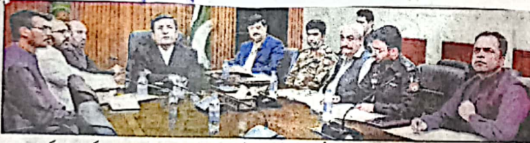
چیف سیکرٹری بلوچستان قذیل قاورخان مختلف اضلاع میں ضمنی اور دوبارہ انتخابات کی تیاریوں کے سلسلے میں مستندہ اجلاس کی صدارت کر رہے ہیں