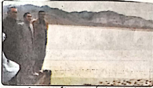
چیف سیکرٹری کی ہدایت پر گلبرگ ایئر بیس کے افسران سرہ زمینی ڈیم کے بند کا معائنہ کر رہے ہیں