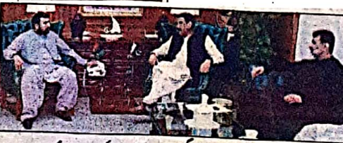
وزیر اعلیٰ بلوچستان سردار فرخاندین خان سے سابق سوانی وزیر اعلیٰ بلوچستان اور میر عبدالجبار بٹو ملاقات کر رہے ہیں۔

شہداء کو بہت بڑے نقصان سے بچایا۔ دہشت گردوں کے خلاف کامیاب آپریشن میں ایک دہشت گرد ہلاک ٹیم ڈی ہوئے مقام کے جانی و مالی نقصان کے لئے ایف سی کی خدمات کو سراہتے ہیں۔ وزیر اعلیٰ نے اس عزم کا اعادہ کیا کہ دہشت گردوں کا قلع قمع کر کے بلوچستان کا امن کی سر زمین بنائیں گے۔