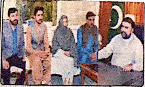
وزیر اعلیٰ بلوچستان میر سرفراز بھٹی سے شہید پبلشنگ سوسائٹی کے وفد نے اجلاس منعقد کیا۔

مجاہدین کی قربانیوں کی یاد دہانی کے سلسلے میں ایک اجلاس منعقد کیا۔