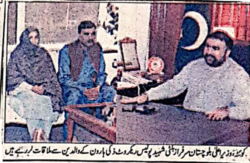
کوئٹہ: وزیر اعلیٰ بلوچستان میر سرفراز ایف سی کے فوری اور کامیاب آپریشن پر اظہار اطمینان سے ملاقات کر رہے ہیں

اطمینان کا اظہار کیا ہے اپنے ایک ٹویٹ میں وزیر اعلیٰ نے کہا کہ ایف سی نے فوری اور کامیاب آپریشن کر کے شہریوں کو بہت بڑے نقصان سے بچا لیا دہشت گردوں کے خلاف کامیاب آپریشن میں ایک دہشت گرد ہلاک تین زخمی ہوئے عوام کے چائی و مالی تحفظ کے لئے ایف سی کی خدمات کو سراہتے ہیں وزیر اعلیٰ نے اس مزہم کا اعادہ کیا کہ دہشت گردوں کا قلع قلع کر کے بلوچستان کو امن کی سر زمین بنائیں گے