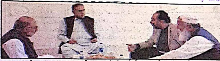
صوبائی وزیر مواصلات و تعمیرات میر سلیم کورم کا یکمین سی اینڈ ویلیر میر علی صوبائی اسمبلی میں جاری ترقیاتی سیشنوں پر پٹرنٹ کے حوالے سے بریفنگ دے رہے ہیں