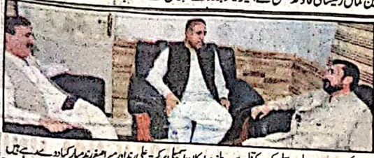
صوبائی وزیر ری اینڈ ویلیر میر سلیم کورم کاندھان نے پرامکان اسپتال برکت علی بنیاد پر امنغز بندھا کر کاؤ سے ہے ہیں