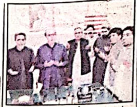
کوئٹہ وزیر صحت فیصل جمالی کو وزارت کی کرسی پر بٹھانے سے قبل دعا کی جا رہی ہے