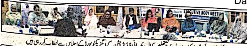
کوئٹہ صوبائی مشیر ڈاکٹر بابہ بلیدی نے تعلیمین کمال ریسرچ فاؤنڈیشن کے ایگزیکٹو بورڈ کے اجلاس سے خطاب کر رہی ہیں