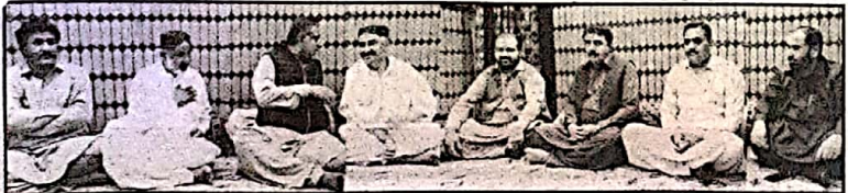
صوبائی وزیر مواصلات و تعمیرات میر سلیم کورم مہرا سائیکل ڈپری کو عمرہ کی سعادت حاصل کرنے پر مبارکباد دے رہے ہیں