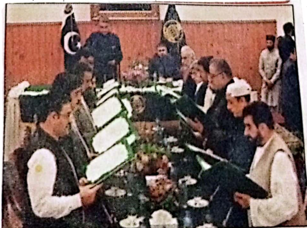
کوئٹہ: گورنر ملک عبدالولیٰ کا کزنو منتخب صوبائی کابینہ سے حلف لے رہے، وزیر اعلیٰ بھی موجود ہیں