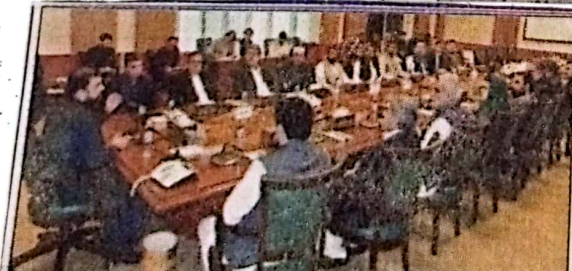
کوئٹہ: وزیر اعلیٰ میر سر فرادین کو منتخب صوبائی کابینہ کے تعارفی اجلاس کی صدارت کر رہے ہیں

کوئٹہ (اسٹاف رپورٹر + این این آئی) بلوچستان میں ڈیڑھ ماہ بعد 14 رکنی صوبائی کابینہ نے اپنے عہدوں کا حلف اٹھا لیا۔ حلف اٹھانے والوں میں چیئر پارٹی اور مسلم لیگ (ن) کے چوچہ جیک بلوچستان عوامی پارٹی (باقی صفحہ 3 نمبر 22) کے ذمہ دار ہیں۔ صوبائی کابینہ کے مطابق گورنر ہاؤس کوئٹہ میں بلوچستان کابینہ میں شامل 14 ذمہ دار حلف برداری کی تقریب ہوئی جس میں گورنر بلوچستان ملک عبدالولی کا کابینہ صوبائی کابینہ کے سربراہ کی حیثیت سے حلف لیا۔ اس موقع پر وزیر اعلیٰ بلوچستان میر سر فرادین نے خطاب کیا۔ انہوں نے کہا کہ بلوچستان میں سب سے بڑا چیلنج ہے۔ عوام کی بہتری کیلئے سب سے بڑا کام ہے۔ انہوں نے کہا کہ آج کے دنوں میں سب سے بڑا چیلنج ہے۔ عوام کی بہتری کیلئے سب سے بڑا کام ہے۔