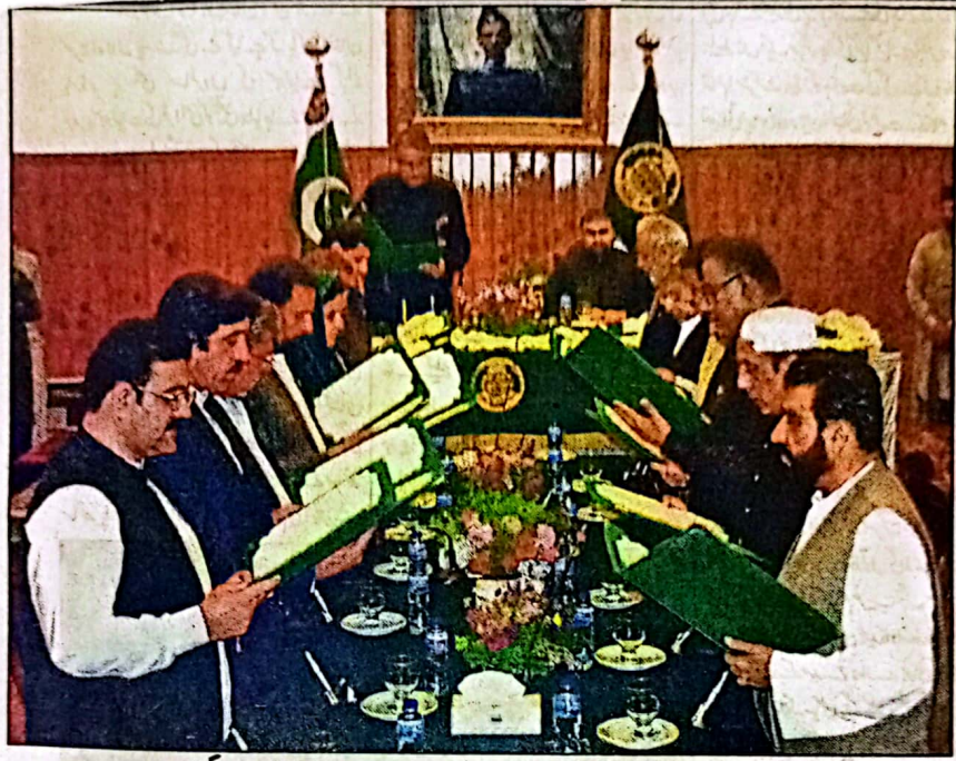
کوئٹہ: گورنر بلوچستان ملک عبدالولیٰ کا کزنو منتخب وزراء سے حلف لے رہے ہیں وزیر اعلیٰ سرفراز کئی بھی موجود ہیں