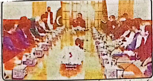
کوئٹہ، وزیر اعلیٰ بلوچستان میر سرفراز بگٹی نے جمعیت صوبائی کابینہ کے تعارفی اجلاس کی صدارت کر رہے ہیں

جمعیت علماء اسلام کے صوبائی امیر مولانا عبدالواحد، مولانا سید محمود شاہ و دیگر بھی موجود تھے۔