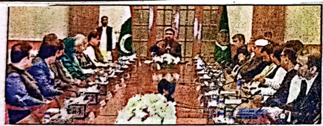
وزیر اعلیٰ بلوچستان میر سرفراز بکٹی نو منتخب صوبائی کابینہ کے تعارفی اجلاس کی صدارت کر رہے ہیں