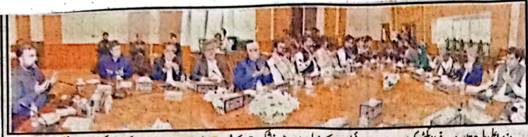
وزیر اعلیٰ بلوچستان میر سرفراز بگٹی کی زیر صدارت صوبائی کابینہ کے پہلے اجلاس میں نوشکی واقعہ کے شہداء، ہارٹوں اور سیلاب میں جاں بحق افراد کیلئے فاتحہ خوانی کی جا رہی ہے۔

مولانا فضل الرحمن سے وزیر اعلیٰ بلوچستان میر سرفراز بگٹی کی ملاقات اس موقع پر جمعیت کے صوبائی امیر مولانا عبدالواحد، مولانا سید محمود شاہ و دیگر بھی موجود تھے کوئٹہ (یو این اے) جمعیت علماء اسلام کے سربراہ سرفراز احمد بگٹی نے جمعہ کے روز ملاقات کی ملاقات مولانا فضل الرحمن سے وزیر اعلیٰ بلوچستان میر سرفراز بگٹی کے موقع پر ..... بجیرہ 7 صفحہ نمبر 7 پر