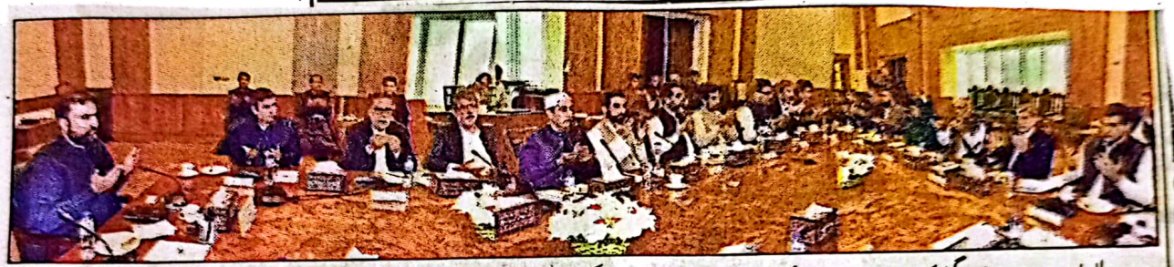
وزیر اعلیٰ بلوچستان میر سرفراز بکٹی کی زیر صدارت صوبائی کابینہ کے پہلے اجلاس میں نوشکی واقعہ کے شہداء، بارشوں اور سیلاب میں جاں بحق افراد کے لئے فاتحہ خوانی کی جارہی ہے