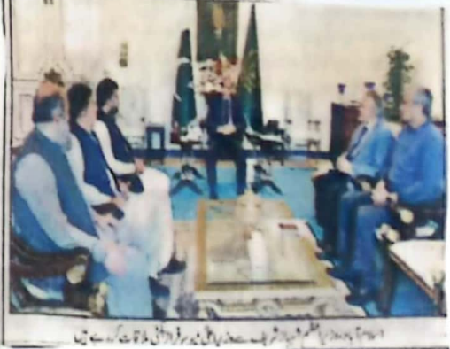
سرکار بلوچستان کی ایک نئی جہت میں ایک نئی شکل کا آغاز

بلوچستان کی ایک نئی جہت میں ایک نئی شکل کا آغاز سرکار بلوچستان کی ایک نئی جہت میں ایک نئی شکل کا آغاز سرکار بلوچستان کی ایک نئی جہت میں ایک نئی شکل کا آغاز