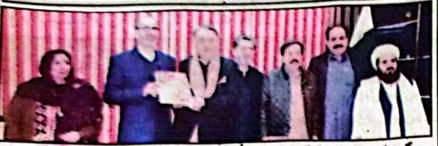
گورنر ملک عبدالولیٰ کا کر کو ایران کے قونصل جنرل حسن درویش وند سوہنر دے رہے ہیں