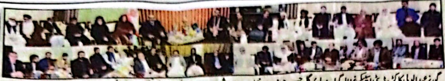
گورنر عبدالولیٰ کا کر، ڈپٹی اسپیکر غزالہ گول، مولوی گل حسن، جنرل مندرخیل، مولانا ہاشمی، مولانا انوار الحق، مولانا عثمانی، دو گیارہائی قونصل جنرل کے اختتامی روز میں شریک ہیں