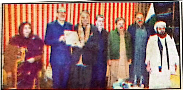
گورنر بلوچستان ملک عبدالولیٰ کا کر کو ایران کے قونصل جنرل حسن درویش وند سوہنر دے رہے ہیں