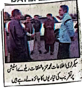
بکروڑی اطلاعات محترمہ مفتحات ریلوے اسٹیشن پر تقریب کی تیاریوں کا جائزہ لے رہے ہیں