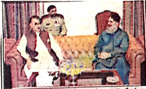
کوئٹہ: گورنر گل محمد اعلیٰ کا کرگاہیں اور اعلیٰ وزیر اعلیٰ میر علی مرادان اڑکی سے صفحہ سہارہ ہے تھا