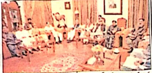
کوئٹہ: گورنر گل محمد اعلیٰ کا کرگاہیں اور اعلیٰ وزیر اعلیٰ میر علی مرادان اڑکی سے صفحہ سہارہ ہے تھا