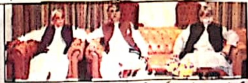
کوئٹہ: گورنر گل محمد اعلیٰ کا کرگاہیں اور اعلیٰ وزیر اعلیٰ میر علی مرادان اڑکی سے صفحہ سہارہ ہے تھا