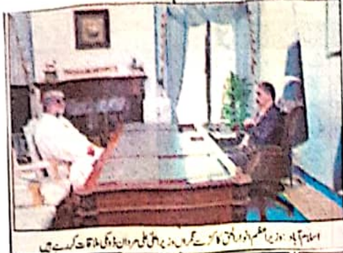
ایڈیٹر جہانگیر احمد اور ایڈیٹر گلبرگ نے وزیر اعلیٰ بلوچستان ڈاکٹر محمد نواز قاسمی سے ملاقات کی۔