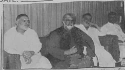
کیا نگرانی وزیر اعلیٰ بلوچستان میر علی مراد خان ڈوگی استقبال کے شرکاء کے ساتھ ان کا جواب دے رہے ہیں