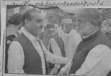
کوئی نگرانی وزیر اعلیٰ بلوچستان میر علی مراد خان ڈوگی کو سماں ڈوگی کے شیرازہ گزرتین ایڈوکیٹ میاں کابا دے رہے ہیں