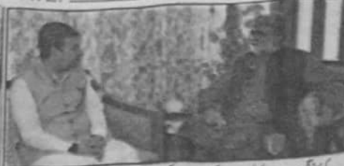
کیا عمران وزیر اعلیٰ مردان ڈوکی سے چیف سیکرٹری بلوچستان کیلئے تقریر کا وقت کر رہے ہیں