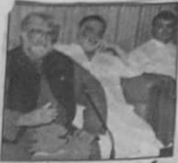
کیا عمران وزیر اعلیٰ میر علی مرادان ڈوکی استقبال کے شراکاء کے سوالوں کے جواب دے رہے ہیں