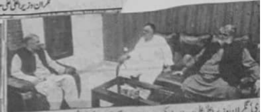
کیا عمران وزیر اعلیٰ مردان ڈوکی سے ایف سی ونگ کمانڈر کرنل شمس ملاحات کر رہے ہیں