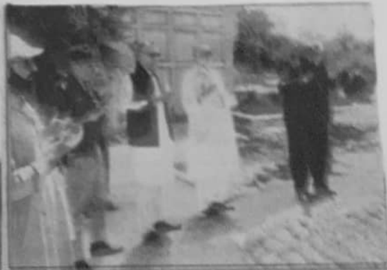
ڈیڑھائی بلوچستان علی سردان اڈکی نے بلوچستان میں کھیتی باڑی کو فروغ دینے کے لیے ایک اجلاس منعقد کیا۔