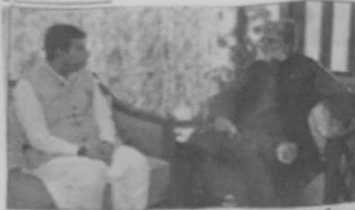
گورنر ڈیڑھائی بلوچستان علی سردان اڈکی سے اجلاس منعقد ہوئے۔ چیف سیکریٹری بلوچستان گل خان صاحب نے شرکت کی۔