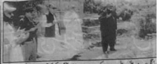
کیا عمران وزیر اعلیٰ میر علی مرادان ڈوکی اپنے والد میر حضور بخش ڈوکی کی قبر پر فاتحہ خوانی کر رہے ہیں