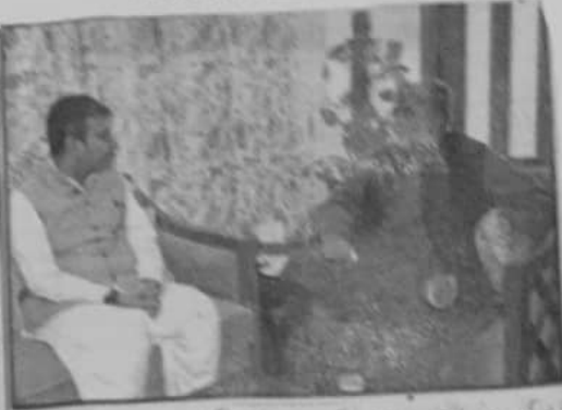
سی ان اے ڈائریکٹر جنرل پبلک ریلیشنز اور ایف ڈی اے سرگودھا کے وفد سے خطاب کر رہے ہیں