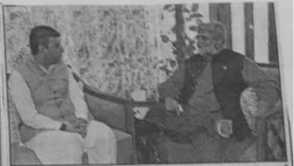
سی ان اے ڈائریکٹر جنرل پبلک ریلیشنز اور ایف ڈی اے سرگودھا کے وفد سے خطاب کر رہے ہیں