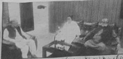
بلوچی نگرانی وزیر اعلیٰ بلوچستان میر علی مراد خان ڈوگی سے ایف سی ونگ کے ماہر رکن حسن ملاقات کر رہے ہیں