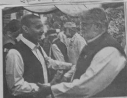
گورنر ڈیڑھائی بلوچستان علی سردان اڈکی نے ایک اجلاس منعقد کیا۔