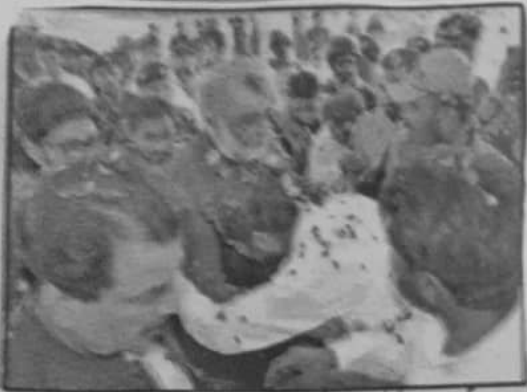
سی ان اے ڈائریکٹر جنرل پبلک ریلیشنز اور ایف ڈی اے سرگودھا کے وفد سے خطاب کر رہے ہیں