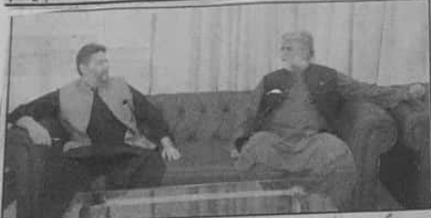
نگران وزیر اعلیٰ بلوچستان میر علی مراد خان ڈوگی سے ملک سٹیئر بار ملاقات کر رہے ہیں