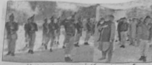
کیا عمران وزیر اعلیٰ مردان ڈوکی کو پولیس کاپٹی دے بغیر دست کار آف آفس آفرم کر رہا ہے