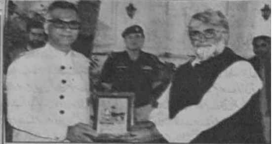
عمران وزیر اعلیٰ میر علی مرادان ڈوکی تھیل ہونے والے چیف سیکرٹری میجر عزیز علی کو شیلڈ دے رہے ہیں