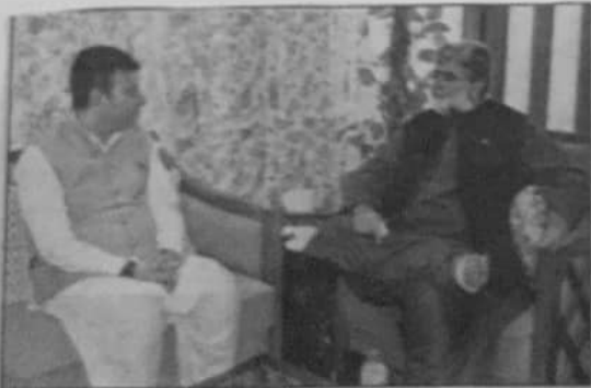
گورنر ڈیڑھائی بلوچستان علی سردان اڈکی سے اجلاس منعقد ہوئی۔ چیف سیکریٹری بلوچستان گل خان صاحب نے شرکت کی۔