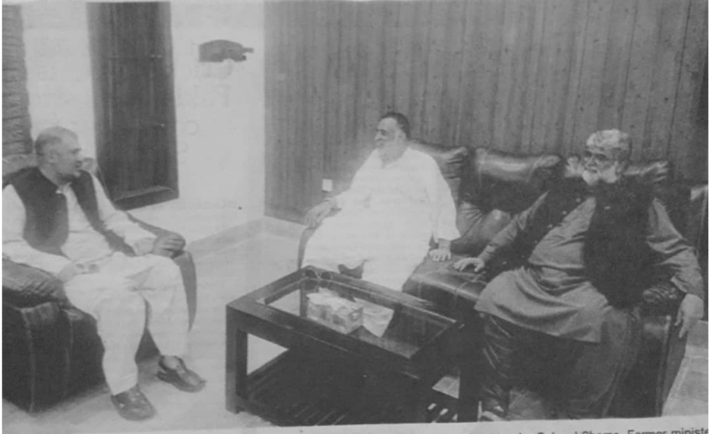
3: Caretaker Chief Minister Balochistan Ali Mardan Domki in a meeting with DC Wing Commander Colonel Shams. Former minister Mir Dostain Khan Domki also present on the occasion.