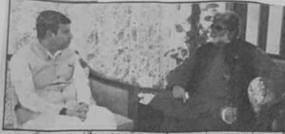
مراں وزیر اعلیٰ بلوچستان میر علی مراد خان ڈوگی سے چیف سیکرٹری بلوچستان فیصل قادر خان ملاقات کر رہے ہیں