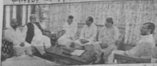
کیا عمران وزیر اعلیٰ مردان ڈوکی سے ممبرانہ ذمہ داری بلوچ انٹیم سالانہ دو گھنٹہ ملاقات کر رہے ہیں