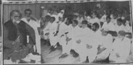
کیا نگرانی وزیر اعلیٰ بلوچستان میر علی مراد خان ڈوگی ملنے والوں سے گفتگو کر رہے ہیں