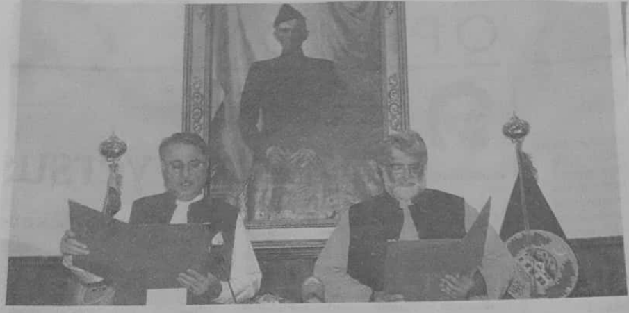
BALOCHISTAN Governor Malik Abdul Wali Khan Kakar administers the oath of office to caretaker Chief Minister Ali Mardan Domki in Quetta, on Friday.