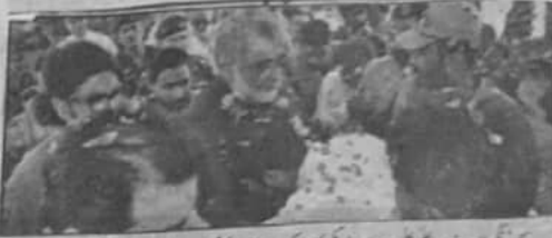
کیا عمران وزیر اعلیٰ مردان ڈوکی کا سرکٹ ہاؤس چھیننے پر دلہانہ استقبال کیا جا رہا ہے