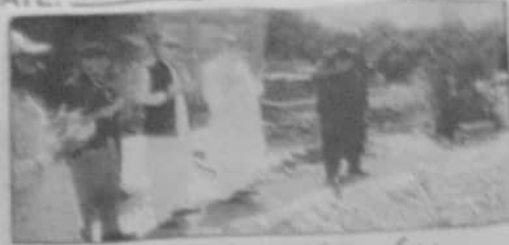
ڈیڑھائی بلوچستان علی سردان اڈکی نے بلوچستان میں کھیتی باڑی کو فروغ دینے کے لیے ایک اجلاس منعقد کیا۔