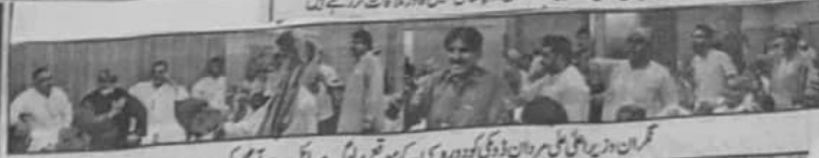
عمران وزیر اعلیٰ مردان ڈوکی کو ذمہ داری کے موقع پر لوگ مسائل سے آگاہ کر رہے ہیں