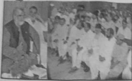
سی ان اے ڈائریکٹر جنرل پبلک ریلیشنز اور ایف ڈی اے سرگودھا کے وفد سے خطاب کر رہے ہیں