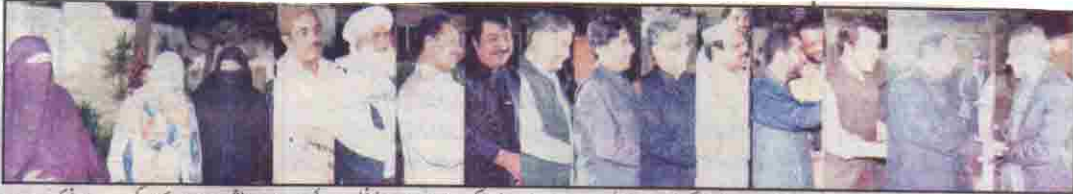
وزیر اعلیٰ بلوچستان میر محمد اقصیٰ بڑنجواہی صاحب سے دئے گئے مشائے میں ایگزیکٹو جہاں ایڈمنیٹریو اور ایگزیکٹو جہاں ایڈمنیٹریو کے اراکان شریک ہیں