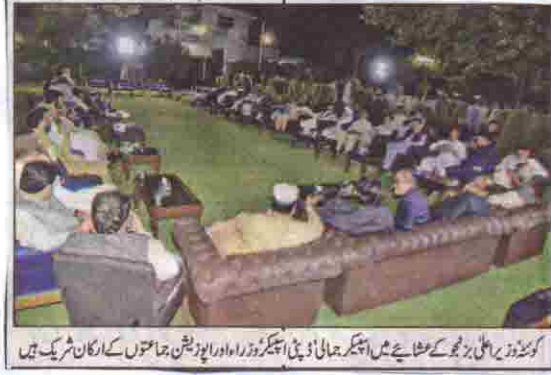
کوئٹہ ریٹیلرز گھو کے مشائے میں ایگزیکٹو جہاں ایڈمنیٹریو اور ایگزیکٹو جہاں ایڈمنیٹریو کے اراکان شریک ہیں