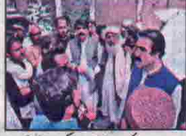
صوبائی وزیر نو محمد سیکڑیٹ میں لوگوں کے مسائل سن رہے ہیں