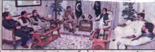
کوئٹہ صوبائی وزیر نو محمد سیکڑیٹ اور اراکان اسمبلی پرنسپل سیکرٹری وزیر اعلیٰ عمران گلگی سے ملاقات کر رہے ہیں