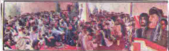
گورنر ملک عبدالولی کاگز کیمپل سرائان یونین کونسل اجروم میں عوامی جرگے سے خطاب کر رہے ہیں