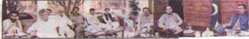
کوئٹہ وفاقی وزیر مملکت برائے توانائی حاجی ہاشم نونیر نے مختلف وفد ملاقات کر رہے ہیں