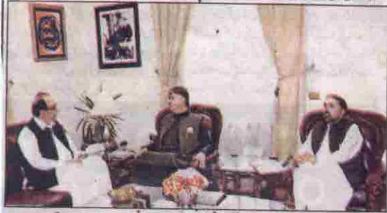
کوئٹہ: گورنر ملک عبدالولی کاگز سے وائس چانسلر فضلہ اربو نیورٹی انجینئر مقصود احمد ملاقات کر رہے ہیں