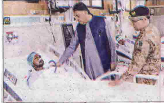
کوئٹہ گورنمنٹ عیدالولی کا گروپ گریڈن پرنسٹن میں زخمی ایسکاروں کی عیادت کر رہے ہیں