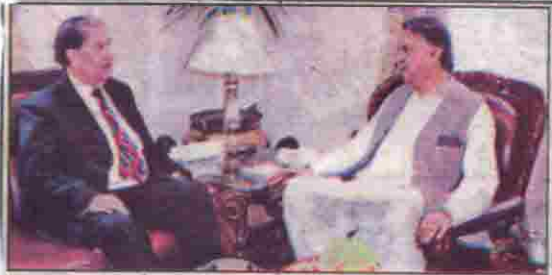
گورنر ملک عبدالولیٰ کا کڑے پوزیشن کے ساتھ وفاقی ریکریڈیز (ر) آغا گل ملاقات کر رہے ہیں