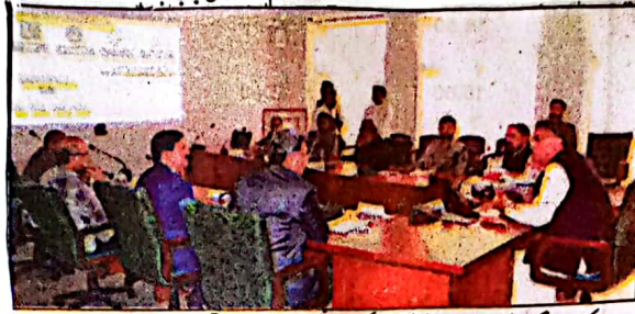
کوئٹہ: گورنر ملک عبدالولیٰ کا کنونٹ کیسپس کے دورے کے موقع پر بریکنگ دی جا رہی ہے