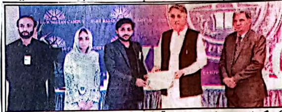
کوئٹہ: گورنر ملک عبدالولیٰ کا کنونٹ کے موقع پر راجیکٹ بنانے والے طلباء میں مزاحیہ اور تقسیم کر رہے ہیں