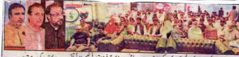
صوبائی وزیر خوراک انجینئر زمر کیکر فری صحت مجیب الرحمن اور ڈی جی فوڈ اتھارٹی نعیم بازلی تقریب سے خطاب کر رہے ہیں