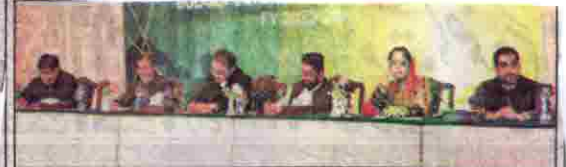
انجینئر زمر کیکر ملک متحدہ ضیاء الحق اور بشری زنگی کی تیاری کے حوالے سے مشاوری اجلاس برکشاہ میں شرکت ہیں