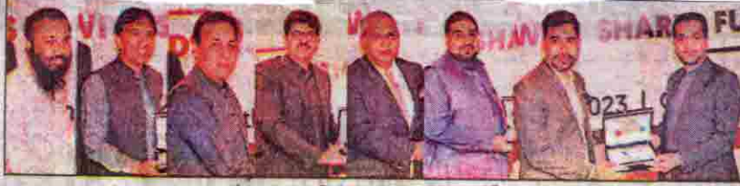
کوئٹہ وزیر داخلہ میر ضیاء الحق کو فرینڈ آف جوائنٹ کے زیر اہتمام تقریب کے شرکاء کو شیلڈ سے رہے ہیں