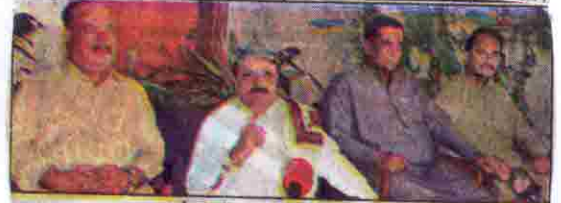
صوبائی وزیر زراعت میر اسد اللہ بلوچ پریس کانفرنس کر رہے ہیں