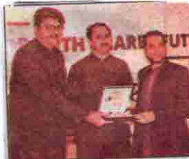
وزیر داخلہ ضیاء الحق کو بین الاقوامی انجمن چیف ایگزیکٹو آفیسر آف کامرس آصف ترین شیلڈ سے رہے ہیں