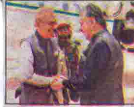
صدر عارف علوی کا کوئٹہ پہنچنے پر گورنر ملک عبدالولی کا کرشمی استقبال کر رہے ہیں