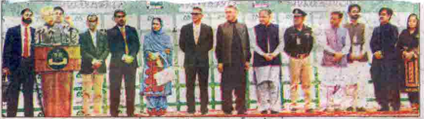
گورنر محترم عارف علوی 34ویں پرنسپل ایجوکیشنل ایسوسی ایشن کے سٹارٹ کا سے خطاب کر رہے ہیں