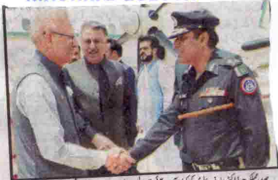
صدر مملکت ڈاکٹر عارف علوی کی کونسل آف آئی جی پولیس بلوچستان میں مذاقات میں مصافحہ کر رہے ہیں