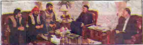
گورنر ملک عبدالولی کا کڑے حقیف شاہ کا کڑے منصور آغا اور حمید اللہ کا ملاقات کر رہے ہیں