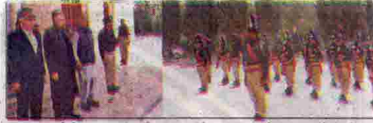
صدر ملک ڈاکٹر عارف علوی کو گارڈ آف آئرن میں کیا جا رہا ہے گورنر ملک عبدالولی کا کرشمی موجود ہیں