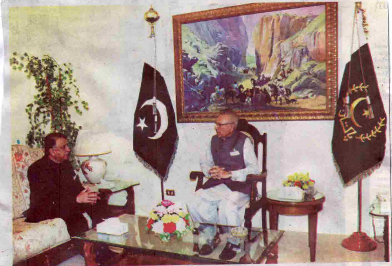
QUETTA: President Dr Arif Alvi in a meeting with Balochistan Governor Abdul Wali Kakar on Tuesday.