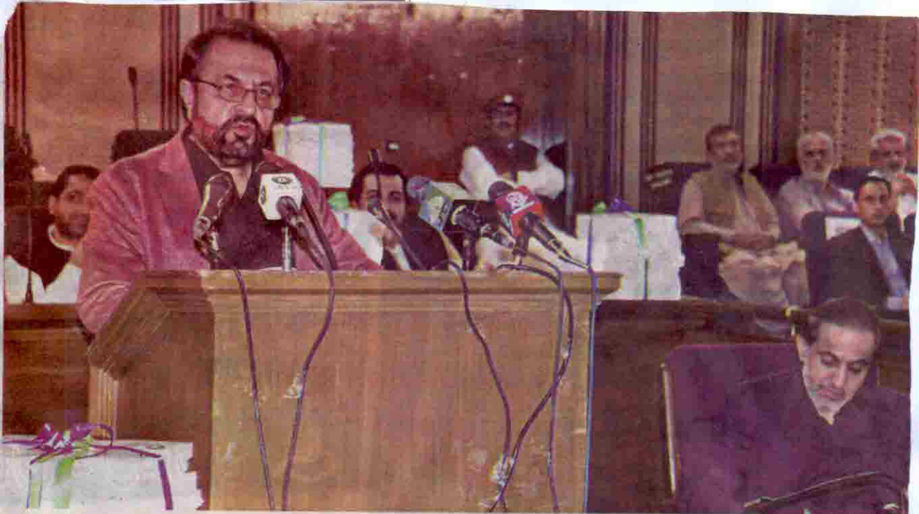
QUETTA: Chief Minister Balochistan Abdul Qudus Bizenjo presiding over budget meeting of the provincial cabinet on Monday.