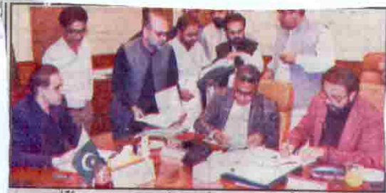
صوبائی وزیر خزانہ اور چیئر مین کابینہ بلوچستان عبدالقُدوس بیزنجو کی صوبائی کابینہ کی 2023-24 کی دستاویزات پر غور کر رہے ہیں