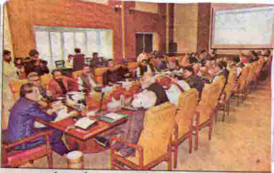
کوئٹہ: وزیر اعلیٰ میر عبدالقدوس بزنجو صوبائی کابینہ کے بجٹ اجلاس کی صدارت کر رہے ہیں