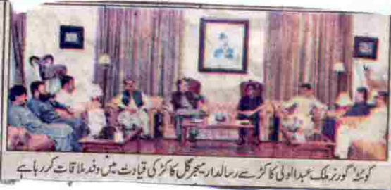
کوئٹہ گورنمنٹ عبدالولی کا کمرے رسالہ دار پبلسٹیج کا کڑی قیادت میں وفد ملاقات کر رہا ہے