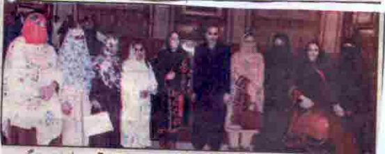
کوئٹہ: وزیر اعلیٰ میر عبدالقدوس بزنجو کے ہمراہ بجٹ پیش ہونے کے بعد خواجہ تاجن پارانٹل سٹریٹز کا گروپ