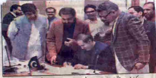
کوئٹہ: وزیر اعلیٰ میر عبدالقدوس بزنجو بجٹ دستاویزات پر دستخط کر رہے ہیں