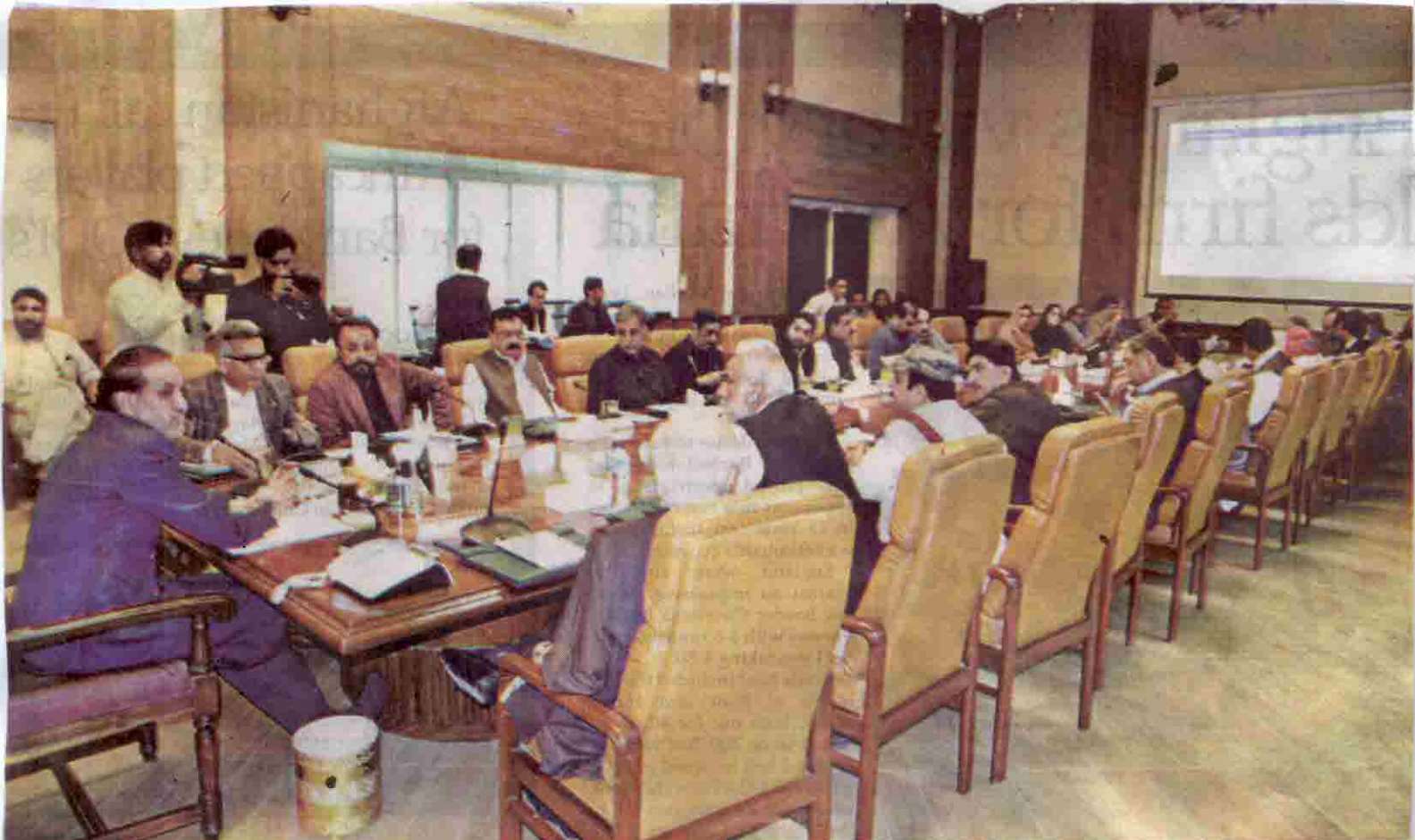
QUETTA: Chief Minister Balochistan Abdul Qudus Bizenjo presiding over budget meeting of the provincial cabinet on Monday.