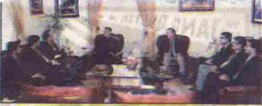
گورنر ملک عبدالولی خان کا کڑے سیر کا کڑی قیادت میں مختلف پارلیمینٹری ممبران کے وفد ملاقات کر رہے ہیں