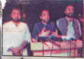
خضدار: وزیر داخلہ میر ضیاء لاکھو پریس کانفرنس کر رہے ہیں