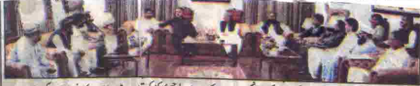
گورنر بلوچستان ملک عبدالولی خان کا کڑے مرکزی انجمن تاجران کے صدر عبدالرحیم کا کڑی قیادت میں تاجروں کا وفد ملاقات کر رہا ہے