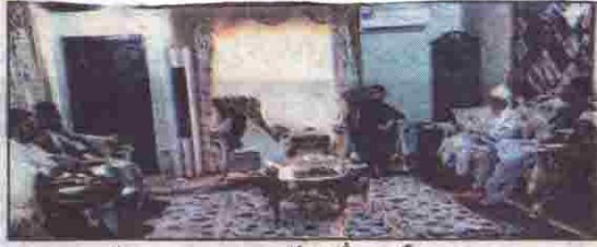
وڈھ: وزیر داخلہ میر ضیاء لاکھو سے میر شفیق مینگل دوران ملاقات بات چیت کر رہے ہیں