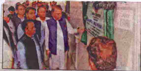
گورنر ملک عبدالولی کا کراچی یونیورسٹی کے اجلاس میں ڈائریکٹر کیمپس کا دورہ افتتاح کر رہے ہیں