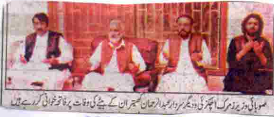
سولائی وزیر مذہبی امور اور صدر اہل سنت والجماعت کے بیٹے کی وفات پر فاتحہ خوانی کر رہے ہیں