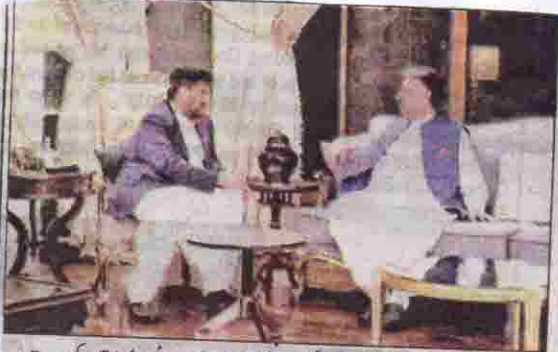
کراچی: گورنر ملک عبدالولی کا کراچی کے صدر ایف آف آرٹس کے دورے کے دوران جامعہ اسلامیہ میں ملاقات کر رہے ہیں