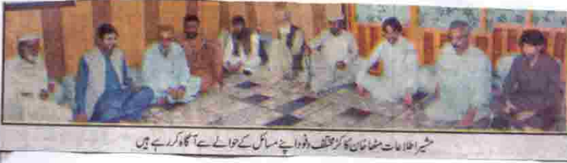
شیراز اہل سنت والجماعت کے ائمہ کا وفد اپنے مسائل کے بارے میں آگاہ کر رہے ہیں