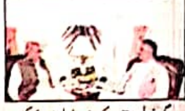
گورنر بلوچستان ملک عبدالولیٰ خان کاگز سے سردار قربان جوگیزئی ملاقات کر رہے ہیں