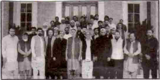
گورنر بلوچستان ملک مہر اولی خان کا آل پاکستان طور پر ایسوسی ایشن کے ممبران کے ساتھ گروپ فوٹو