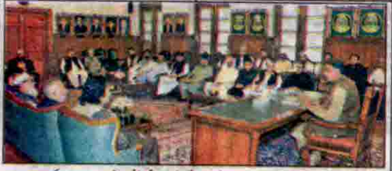
گورنر بلوچستان سے سینئرل چیئرمین آل پاکستان طور پر ایسوسی ایشن عا مہ مشاورات کرتے ہوئے ہیں