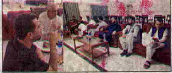
ٹروپ وزیر داخلہ میر نسیا، لاہور ضلعی انٹران سے خطاب کر رہے ہیں