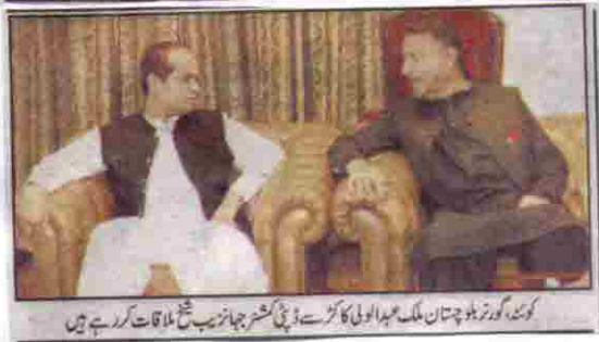
کوئٹہ، گورنر بلوچستان ملک مہر اولی کا آل پاکستان سے ڈپٹی گورنر جہانزیب شاہ ملاقا کرتے ہوئے ہیں