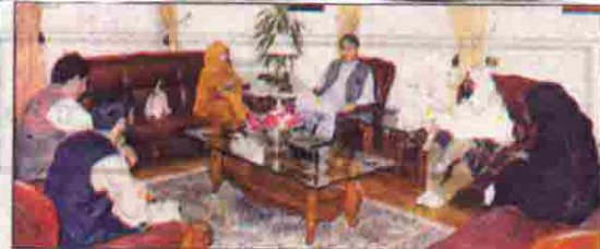
گورنمنٹ عیدالاولیٰ کانفرنس سے بی این بی آئی اے کے وفد کی قیادت میں وفد ملاقات کر رہا ہے