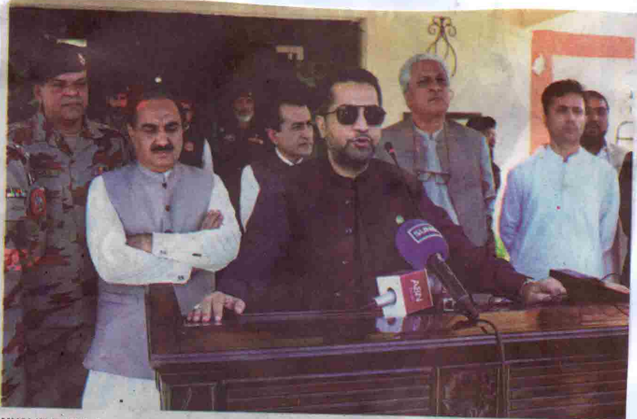
MUSLIM BAGH: Home Minister Ziaullah Lango talking to media during his visit to Qila Saifullah Scouts on Sunday.