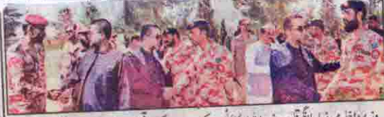
وزیر داخلہ مر فیاض لنگو قائد سیف اللہ راکوٹس کے دورے کے موقع پر جوانوں سے معافی کرتے ہیں