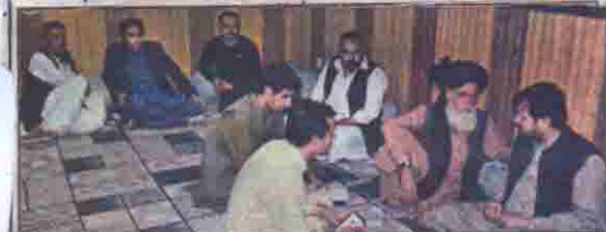
کوئٹہ: مشیر اطلاعات مسلمان خان کا کراچی کے مسائل میں رہے ہیں