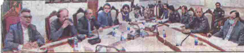
کوئٹہ چیف سیکرٹری میڈیا سمریز مہتممی پراونشل ٹاسک فورس برائے انسداد سرگتنگ اجلاس کی صدارت کر رہے ہیں