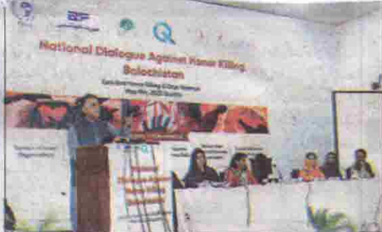
کوئٹہ: گورنر ملک عبدالوہابی کا کرشمہ خاں کے مسائل پر مشفقانہ سیمینار سے خطاب کر رہے ہیں