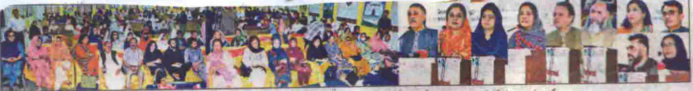
گورنر ملک عبدالوہابی کا کرشمہ خاں، اراکین صوبائی اسمبلی اور نوریہ جو، سید عرفان سید، منظور احمد و دیگر سیمینار سے خطاب کر رہے ہیں