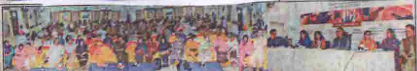
کوئٹہ: گورنر ملک عبدالوہابی کا کرشمہ خاں، اراکین صوبائی اسمبلی اور نوریہ جو، سید عرفان سید، منظور احمد و دیگر سیمینار سے خطاب کر رہے ہیں