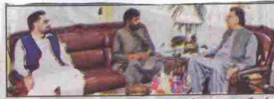
کوئٹہ: گورنر ملک عبدالوہابی کا کوسٹ سے بی این بی کے رجنہ صاحبہ الباطنی ملاقات کر رہے ہیں