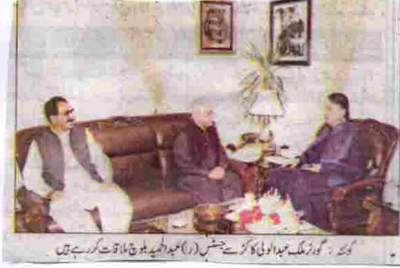
گورنر ملک عبدالولیٰ کاکڑ سے جنس (ر) امجد الما بلوچ ملاقات کر رہے ہیں