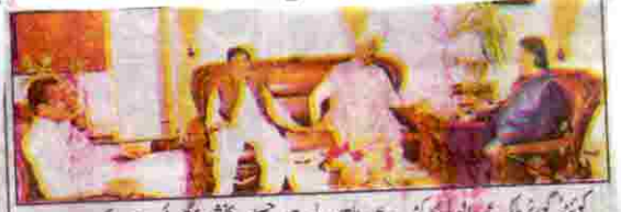
گورنر ملک عبدالولیٰ کاکڑ سے امجد الما اور بلوچ اور حسین بخش شفقوٹی ملاقات کر رہے ہیں