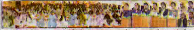
گورنر ملک عبدالولیٰ کاکڑ، بشریٰ زنگہ کامریڈ ایف ایس ڈی، بلوچ، امجد الما کاکڑ اور دیگر تقریب صنف برداری سے خطاب کر رہے ہیں