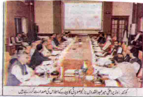
گورنر امجد الما بلوچ، امجد الما بلوچ اور بلوچ اور حسین بخش شفقوٹی ملاقات کر رہے ہیں