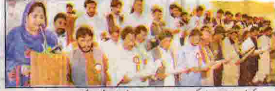
صوبائی شیر اثری رخصول بکیر فریت اسٹاف ایسوسی ایشن کے منتخب فوکل پرسنز سے حلف رتی ہیں