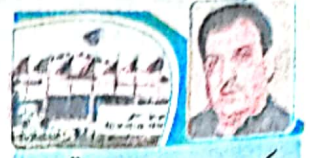
کوئٹہ سے رضا الرحمان کا تجزیہ