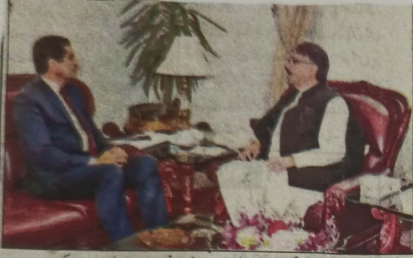
کوئٹہ گورنر ملک عبدالولی خان کاڑ سے وی سی اسمیلہ بی بی کی سربراہی میں وفد کی طرف سے بلوچ ملاقات کر رہے ہیں