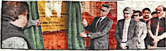
کوئٹہ چیف سیکرٹری عبدالمعز عقیلی بلوچستان سول سروس اکیڈمی کا افتتاح کر رہے ہیں