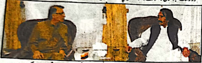
کوئٹہ: گورنر ملک عبدالولیٰ کا کڑ سے سابق صوبائی وزیر عبدالکریم نوشیروانی ملاقات کر رہے ہیں