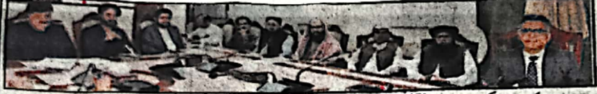
کوئٹہ چیف سیکرٹری عبدالمعز عقیلی سے مردم وفاقہ شماری کے سلسلے میں مختلف پارٹیوں کے نمائندوں سے ملاقات کر رہے ہیں