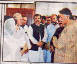
گورنر ملک عبدالولی کا کونوٹوشی میں سرکاری ہسپتال میں ڈاکٹرز سے بات چیت کر رہے ہیں