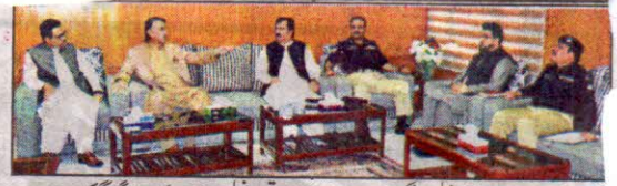
گورنر ملک عبدالولی کا کونوٹوشی کے دورے کے موقع پر ضلعی انتظامیہ کیساتھ گفتگو کر رہے ہیں