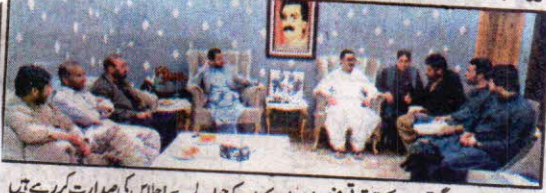
وزیر داخلہ ضیاء لاہوٹا کے تقریباً منسوبوں اور بجٹ کے حوالے سے اجلاس کی صدارت کر رہے ہیں