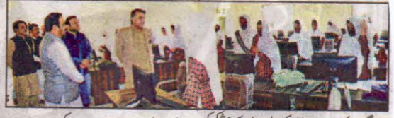
گورنر ملک عبدالولی کا کونوٹوشی کیس میں مطالبات سے بات چیت کر رہے ہیں