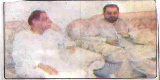
گورنر بلوچستان جان محمد جمالی سے چیئر مین بلال احمد سید شیرانیوں ملاقات کر رہے ہیں