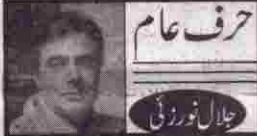
حرف عام جلال نورزئی

وفاقی شریعت عدالت اور بلوچستان ہائی کورٹ کے سابق چیف جسٹس جسٹس ریٹائرڈ محمد نور مسکانزئی کو مسیح افراد نے مسجد کے اندر مشاعرہ کی غماز کے دوران گولیاں برس کر قتل کر دیے۔ یہ پٹیشنر ساتھ 14 اکتوبر کو ان کے آبائی علاقے خاران میں پیش آیا۔ مسکانزئی خاران شہر میں رہائش پذیر تھے۔ صوبے کی ایک نمائندگی اور اعلیٰ شہرت کے حامل شخصیت کے ہیمانہ کل پر صوبہ مفہوم ہوا ہے۔ 15 اکتوبر کو کوئٹہ اور صوبے کے تمام اضلاع کی