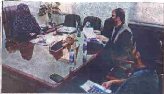
کوئٹہ پارلیمانی سیکرٹری قانون سائنس اینڈ انفارمیشن ٹیکنالوجی ڈاکٹر ربابہ خان بلیدی سے یوسف شعبہ تحفظ اطفال بلوچستان کے سربراہ ڈاکٹر محمد ہمایوں امیری اور نیوٹریشن اسپیشلسٹ محمد عمران جتوئی ملاقات کر رہے ہیں