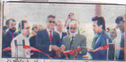
کوئٹہ، چیف سیکرٹری عبدالعزیز عقیلی جاموہر بلوچستان کے دورے پر اس چائسلر پرو فیئر ڈاکٹر شفیق الرحمن کے ہمراہ جاموہر کے شہر قان آرش میگیس کے زیر اہتمام تصویر کشی کا افتتاح کر رہے ہیں