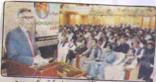
چیف سیکرٹری بلوچستان عبدالعزیز عقیلی یونیورسٹی میں گورنرس پریکچر دے رہے ہیں