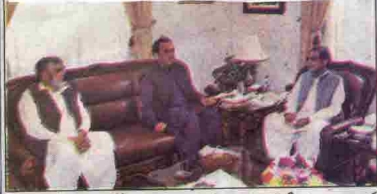
کوئٹہ: دستا مقام گورنر مسیحو جہان محمد نسالی سے صوبائی مکتبہ بڈر بلوچ اور ڈی جی پینتھب راگم سپورٹس پروگرام مسجد الجبار ملاقات کر رہے ہیں