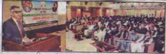
چیف سیکرٹری بلوچستان عبدالعزیز عقیلی یونیورسٹی میں گورنرس پریکچر دے رہے ہیں