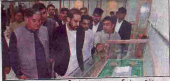
وزیر اعلیٰ قدوس بزنجور گڑھ میوزیم کے افتتاح کے موقع پر نوادرات کا سائیکل کر رہے ہیں