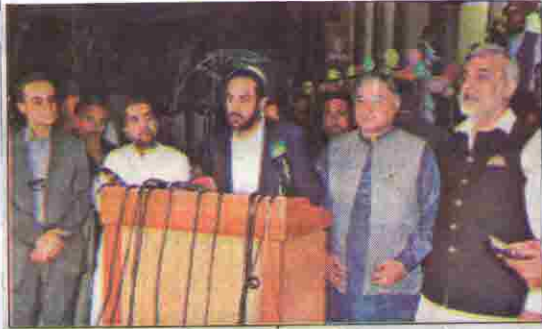
کوئٹہ: وزیر اعلیٰ عبد القدوس بزنجور گڑھ میوزیم کے افتتاح کے موقع پر میڈیا سے گفتگو کر رہے ہیں