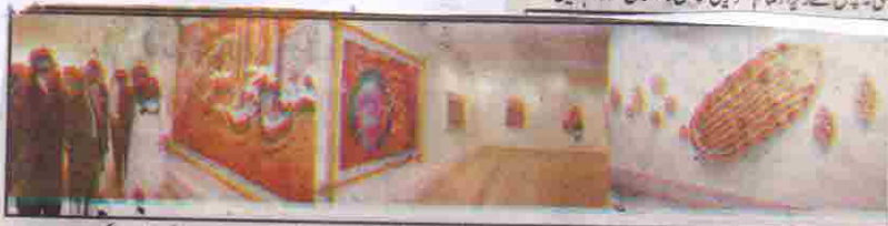
چیف سیکرٹری بلوچستان عبدالعزیز عقیلی بلوچستان میں تصویر کشی کے موقع پر طلباء و طالبات کی جانب سے ہانکے گئے تصاویر دیکھ رہے ہیں