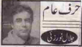
حرف عام جلیل زہری