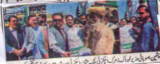
پشیم، صوبائی وزیر خوراک ڈیمک، ایگزیکٹو ملک عثمان ایجنٹ اور شیڈ ناصر سرکاری آف آفیسر کر رہے ہیں۔