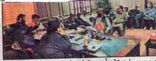
وزیر زراعت اسد بلوچ زرگی تحقیقاتی ادارے کے افسروں کے ہمراہ اجلاس کے دوران خطاب کر رہے ہیں۔ لیٹر مقام گورنر جان بھائی کابو نیورٹی آف فور لائی کے پانچویں سینٹ اجلاس کے موقع پر گروپ