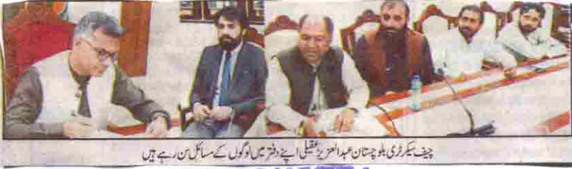
چیف سیکرٹری بلوچستان عبدالعزیز عقلی اپنے دفتر میں لوگوں کے مسائل سن رہے ہیں