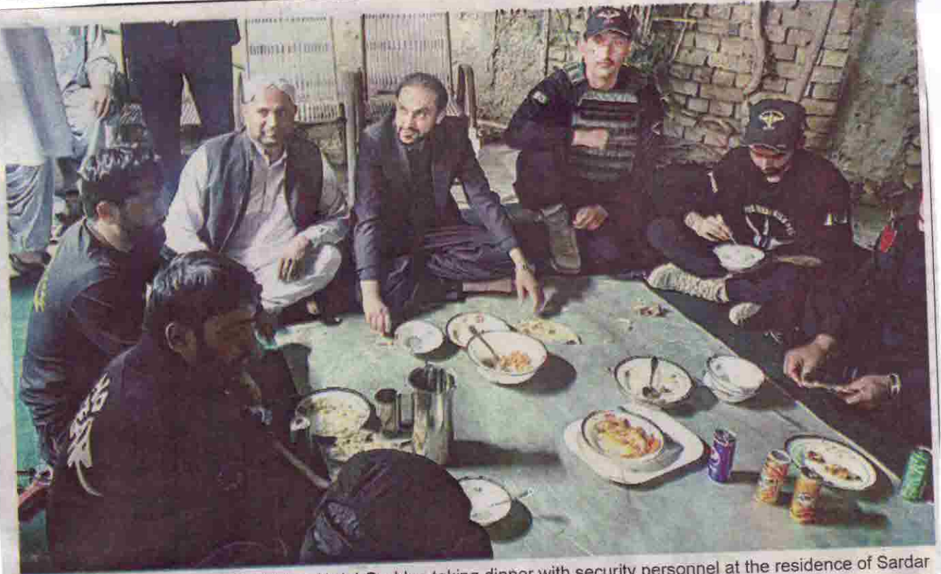
QUETTA: Chief Minister Balochistan Abdul Qudus taking dinner with security personnel at the residence of Sardar Abdur Rehman Khetran.