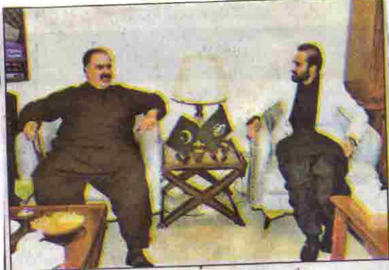
وزیر اعلیٰ میر عبدالقدوس بزنجو سے نواب شاہ ذہیری ملاقات کر رہے ہیں