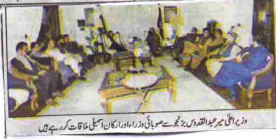
وزیر اعلیٰ میر عبدالقدوس بزنجو سے صوبائی وزراء اور ارکان اسمبلی ملاقات کر رہے ہیں