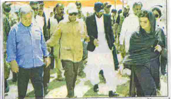
وزیراعظم شہباز شریف اور اقوم متحدہ کے سیکرٹری جنرل امتیاز گورنر اوسٹ محمد کا دورہ کر رہے ہیں