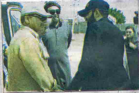
اوسٹ محمد: وزیر اعلیٰ بلوچستان قدوس بزنجور وزیراعظم شہباز شریف کا استقبال کر رہے ہیں