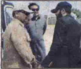
اوسٹ محمد وزیراعظم شہباز شریف اور وزیر اعلیٰ عبدالقدوس بزنجوبات چیت کر رہے ہیں