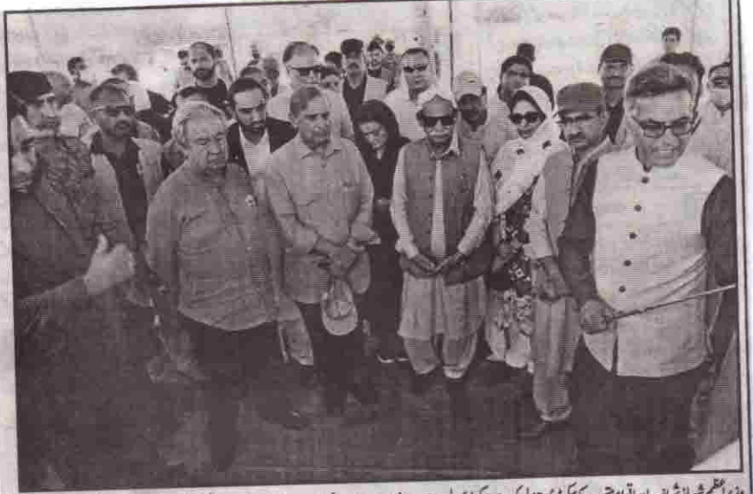
وزیر اعظم شہباز شریف اور انوار احمد کے سیکرٹری جنرل کو چیف سیکرٹری بلوچستان بارش اور سیلاب کے بعد صوبہ میں آمد اور شمالی کوششوں سے متعلق برائٹنگ دے رہے ہیں