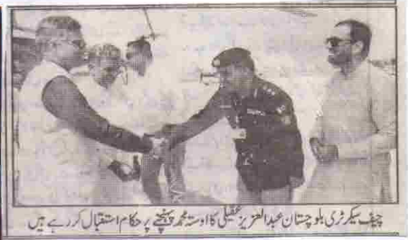
چیف سیکرٹری بلوچستان عبد العزیز عقیلی کا 16 ویں گھر چننے پر حکام استقبال کر رہے ہیں