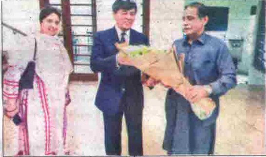
اسلام آباد: قائم مقام گورنر میر جان محمد جمالی اور پاکستان کے سفیر ایک عارف عثمانوف کو گلہ سروس رہے ہیں