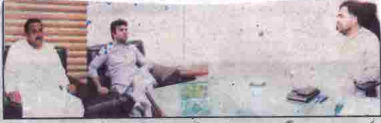
کوئٹہ ڈی جی پی آر اور نگزیب کاسی سے سردار شہزاد ترین اور نجیب اللہ کا ملاقات کر رہے ہیں