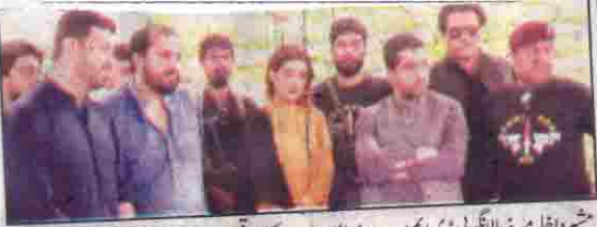
شیر داغلیہ میرضیا الہ آبادی ڈی ایم اے ویٹر ماؤس دورہ کے موقع پر امدادی اشیاء کا جائزہ لے رہے ہیں