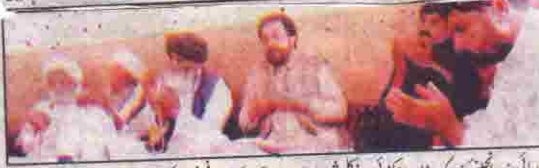
صوبائی وزیر اعلیٰ سرگرم خان اچکزئی نے اعلیٰ شیخان میں خان آغا کے بیٹے کی شہادت پر فاتحہ پڑھائی کر رہے ہیں