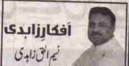
افکار زایدی نایم الی زایدی

بلوچ عوام کے دل آج بھی پاکستان کے ساتھ بڑھ کر ہیں اور پاکستان کی ترقی بلوچستان کی ترقی سے جڑی ہے۔ 347,188 مربع کلومیٹر کے رقبے پر پھیلا ہوا صوبہ پورے ملک کا 43 فیصد حصہ بنتا ہے۔ یہ آبادی کے اعتبار سے سب سے چھوٹا اور مسابقتی اعتبار سے پاکستان کا سب سے تیز علاقہ ہے۔ پورے ملک کو سوئی گیس کی فراہمی اسی سرزمین کا انمول تحفہ ہے۔ اس کے علاوہ کپرا اور سوئے کی کانوں سمیت قدرت نے بے