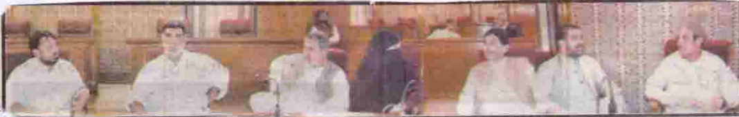
کوئٹہ صوبائی وزیر میر سکندر مہرانی سینیٹن خان عینی نصیب اللہ مری دو دیگر اسمبلی اجلاس کے دوران تبادلہ خیال کر رہے ہیں