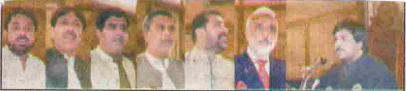
قائم مقام اسپیکر صوبائی اسمبلی سردار بابر خان مہدی شکل کی زیر صدارت صوبائی وزیر داماد ارمان صوبائی اسمبلی اجلاس میں پوائنٹ آف آرڈر پر اظہار خیال کر رہے ہیں