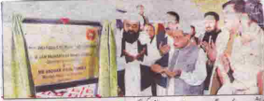
ایشیئن: قائم مقام گورنر میر جان محمد جمالی و چیئرمین پیپلز پیٹریل کا افتتاح کرنے کے بعد دعا مانگ رہے ہیں