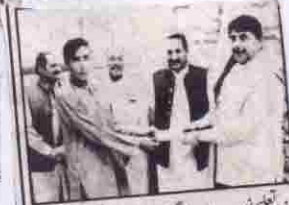
وزیر تعلیم انیسب اللہ مری گورنمنٹ پوزیٹو ایٹمی سکول پش روڈ کے پوزیشن ایبلڈ سید سارشل کو افتتاح سے ہے ہیں