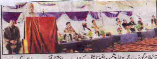
قائم مقام گورنر جان محمد جمالی پشین و شیئر چیئرمین کے حوالے سے افتتاحی تقریب سے خطاب کر رہے ہیں